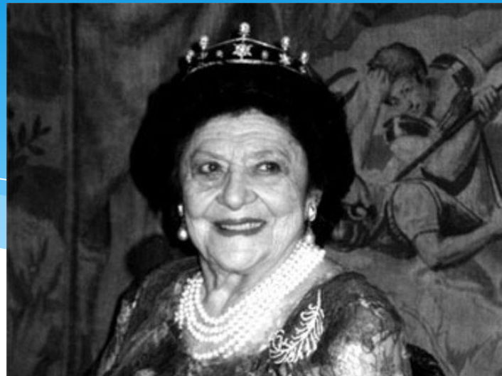
Княгиня Мария Владимировна.