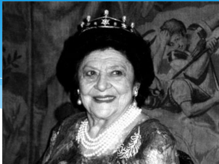
Княгиня Мария Владимировна.