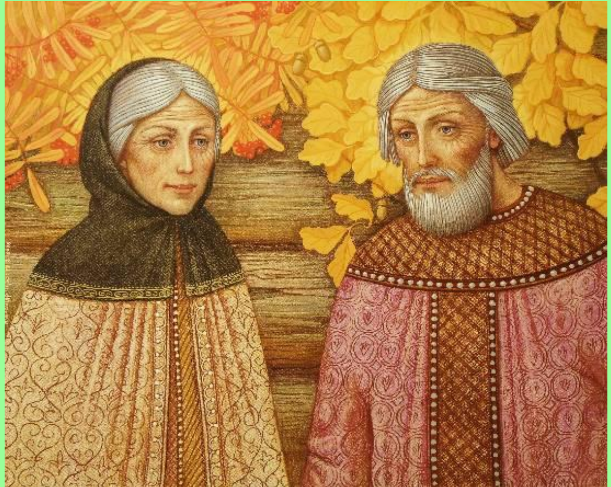
Петр и Феврония