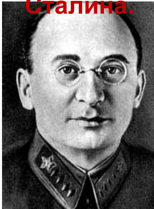
Л.П.Берия –первый зам. предсовмина, вновь возглавил МВД.