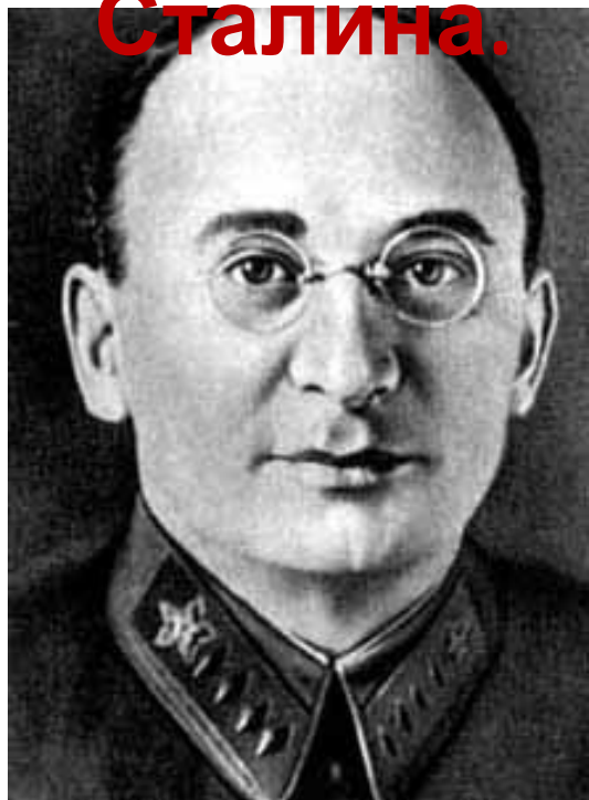
Л.П.Берия –первый зам. предсовмина, вновь возглавил МВД.