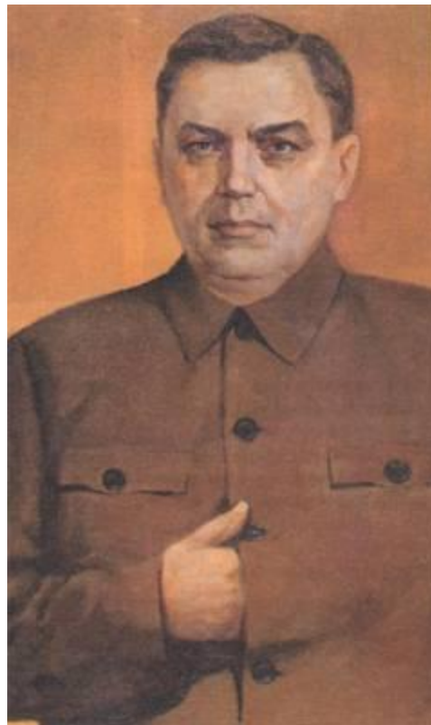
Г.М.Маленков – Председатель Совета Министров СССР.