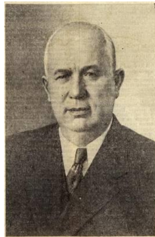
Н.С.Хрущев – секретарь ЦК КПСС.