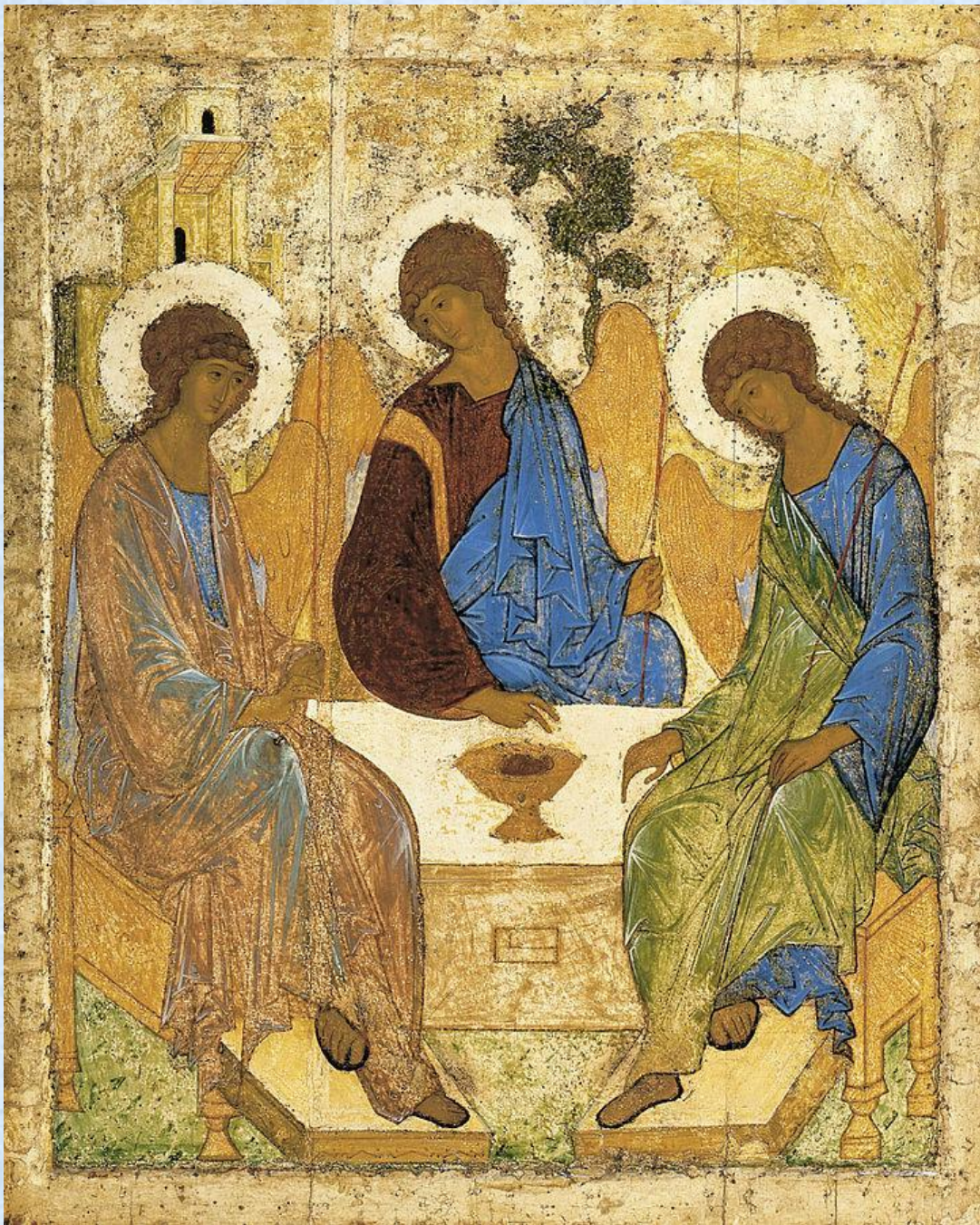
Святая Троица, 1410-е.