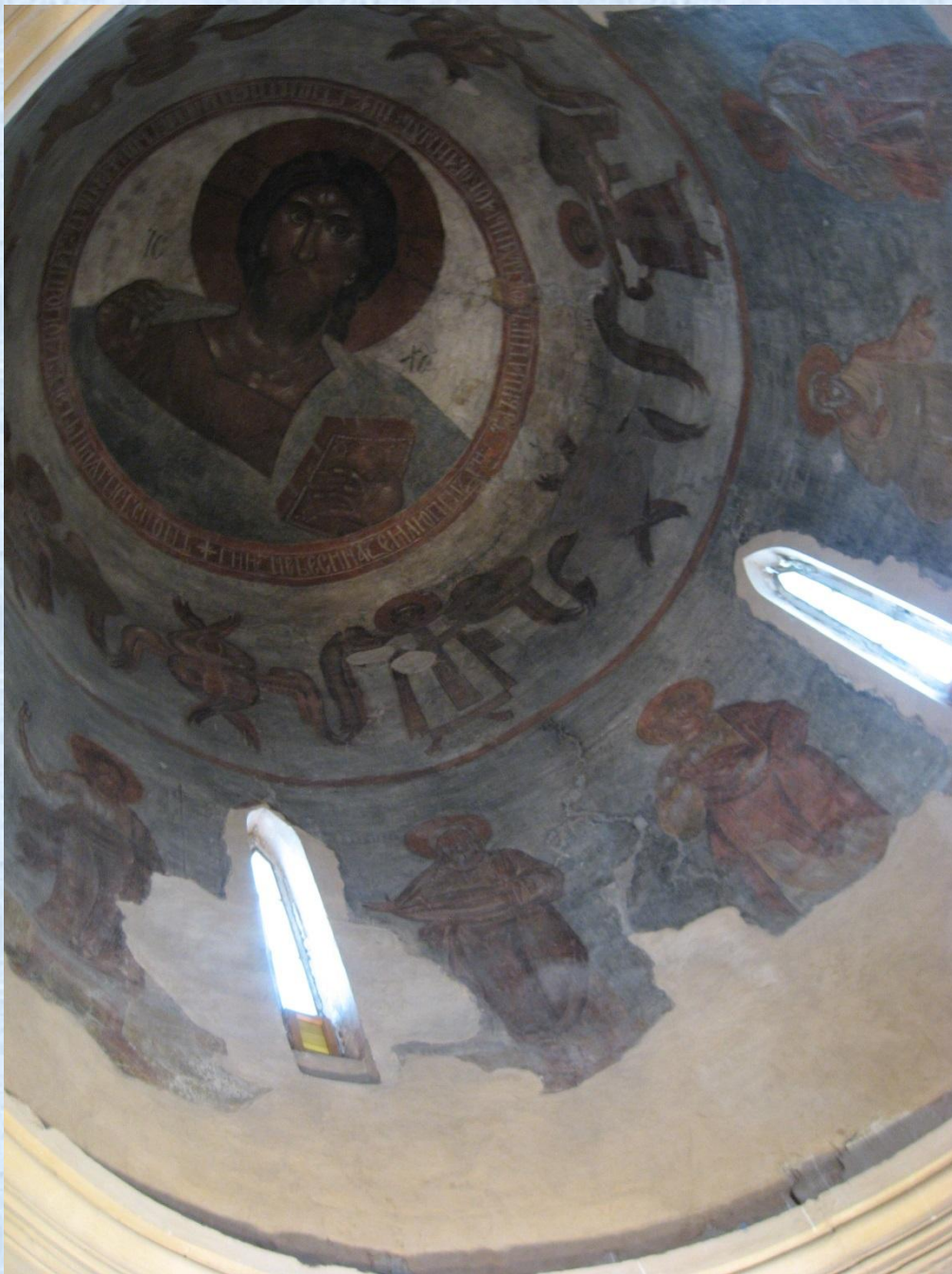
Феофан Грек. Фрески купола. 1378 год.