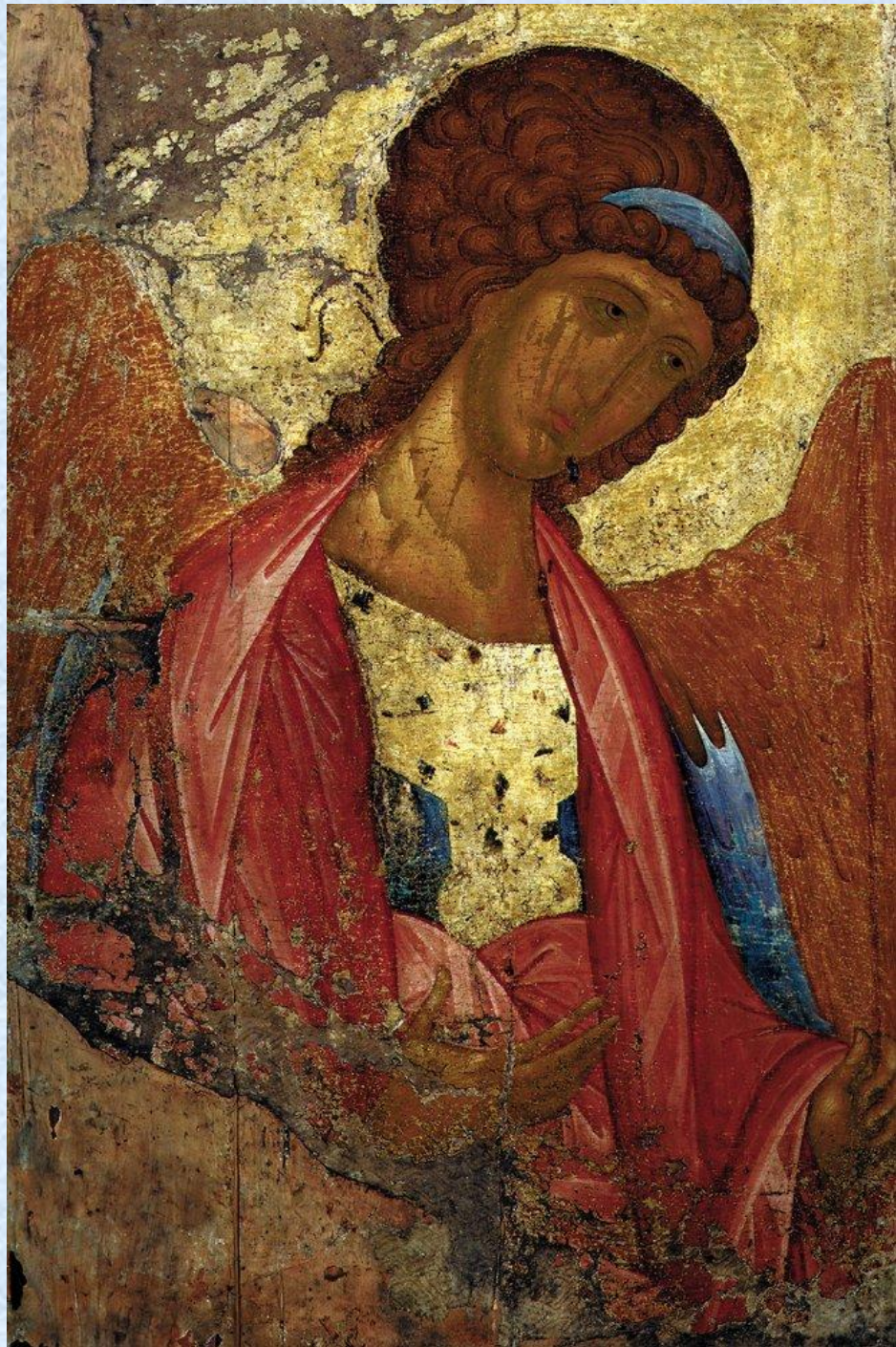
Андрей Рублев. Архангел Михаил. Из Деисусного чина ("Звенигородский"), 1414