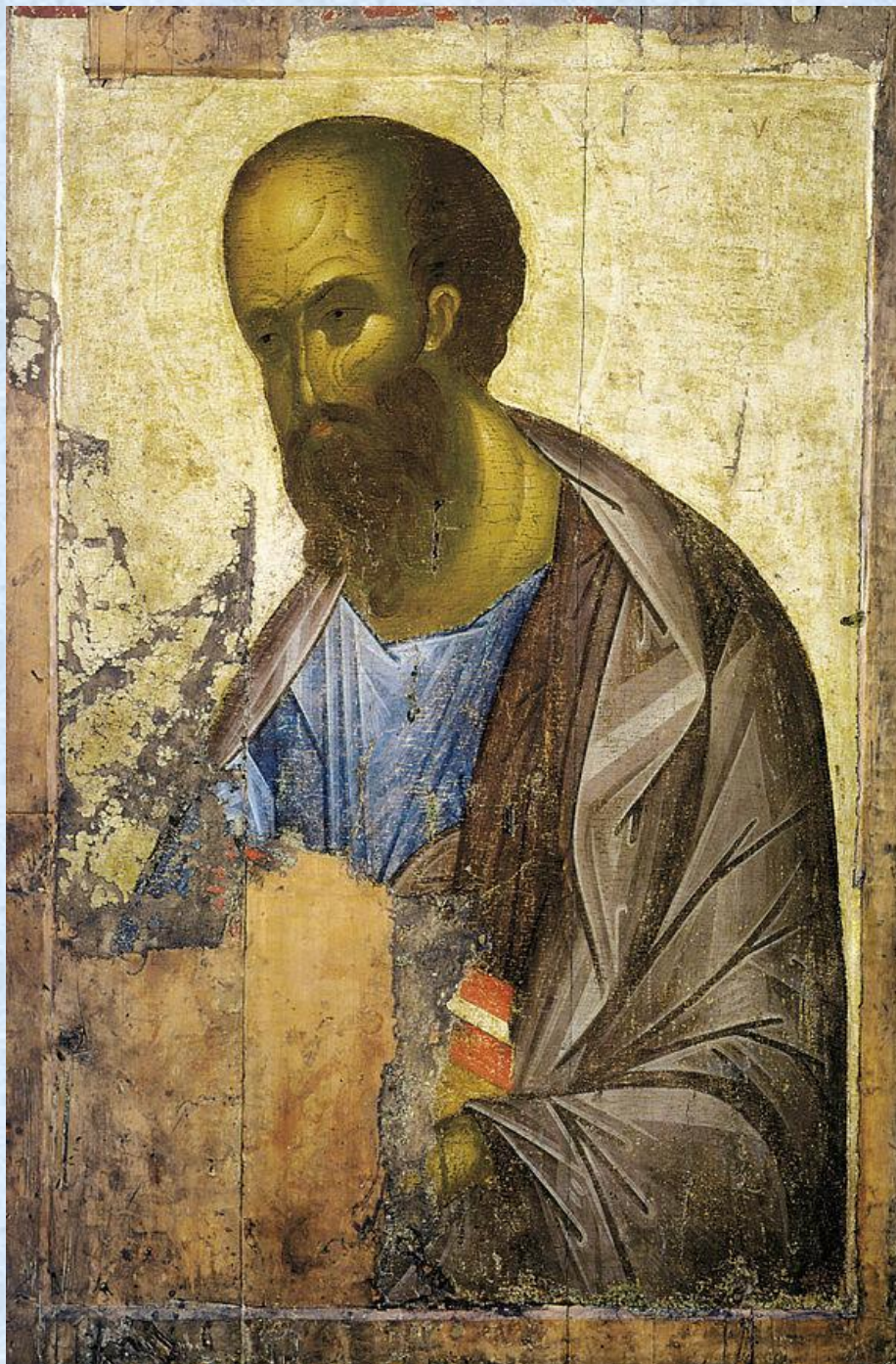
А. Рублев Апостол Павел. Из Деисусного чина ("Звенигородский") 1410—1420