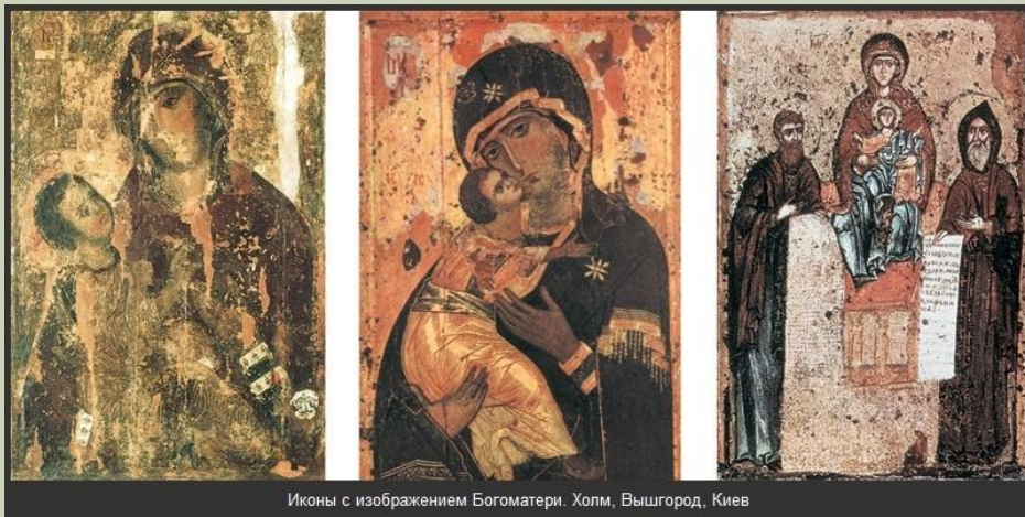
Иконы с изображением Богоматери. Холм, Вышгород, Киев

Из достопримечательностей тогдашнего изобразительного искусства всего впечатляют монументальные изображения мозаики и фрески , которыми украшались храмы.