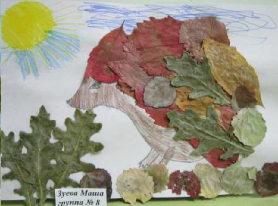
Зыева Маура группа № 8