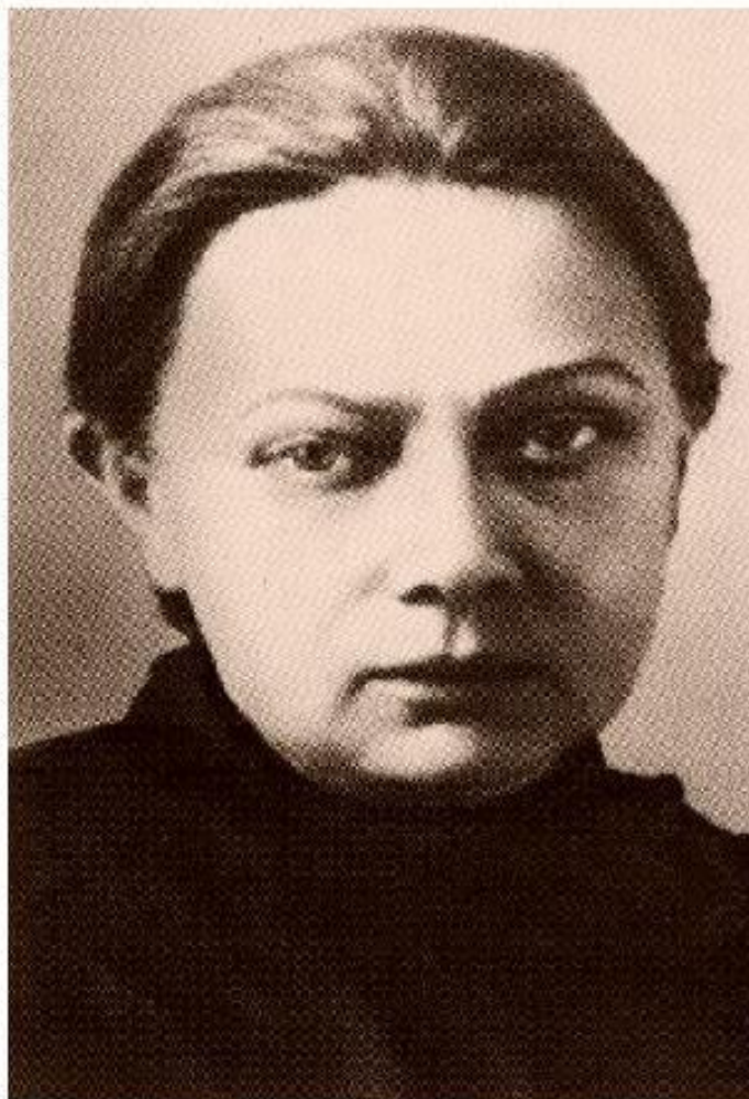
Крупская Надежда Константиновна