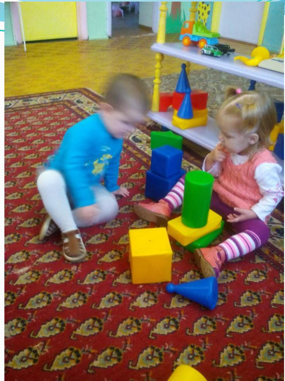
Игры с крупным строителем