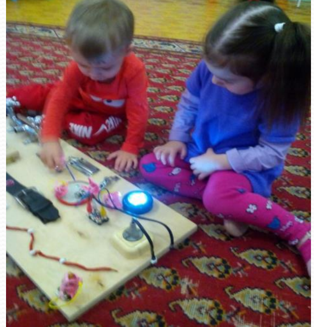
Два замечательных «Бизи-борда»