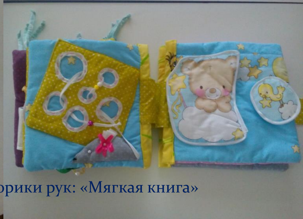
Игры на развитие мелкой моторики рук: «Мягкая книга»