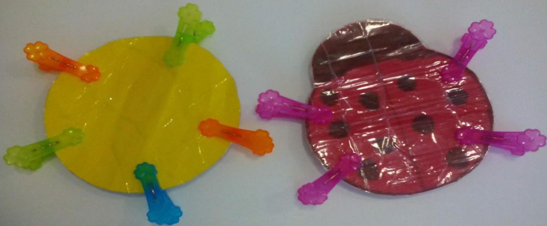
Игры с прищепками «Солнышко» и «Жук»