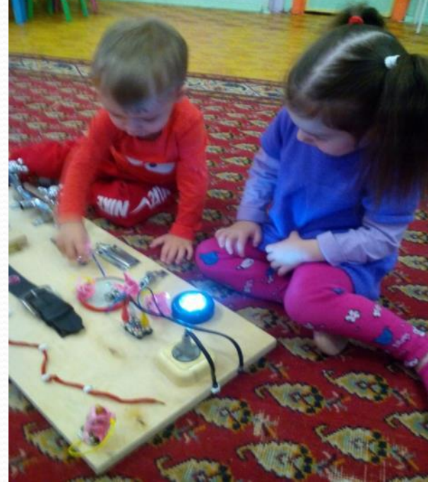
Два замечательных «Бизи-борда»