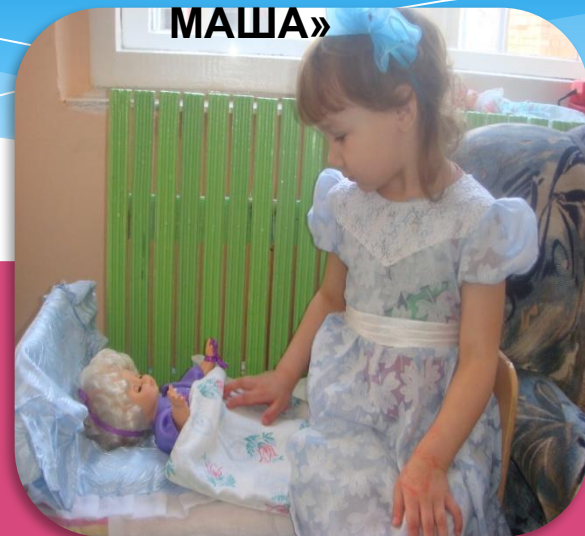
В ГОСТЯХ У МАШИ