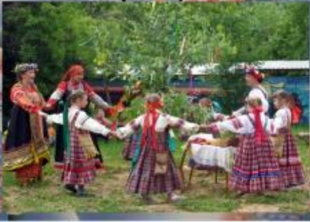
Праздник русской берёзки «Троица»

Мероприятия направленные на реализацию проекта.