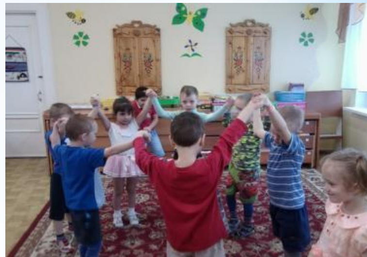
«КОТ И МЫШИ»