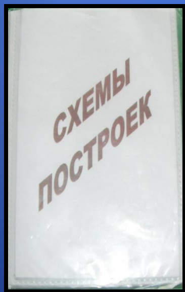
Объемные геометрические фигуры