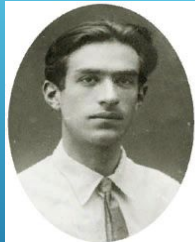
А.Н. Леонтьев 1924 г.

Углубил разработку идей Л.С. Выготского о ведущем виде деятельности. Благодаря его работам ведущая деятельность рассматривается, как критерий периодизации психического развития, как показатель психологического возраста ребенка.