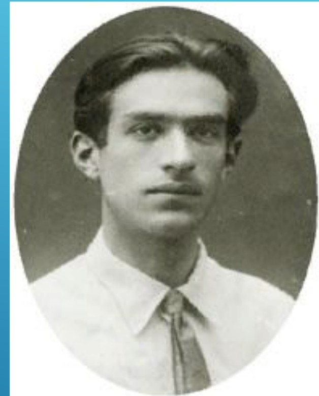
А.Н. Леонтьев 1924 г.

Углубил разработку идей Л.С. Выготского о ведущем виде деятельности. Благодаря его работам ведущая деятельность рассматривается, как критерий периодизации психического развития, как показатель психологического возраста ребенка.