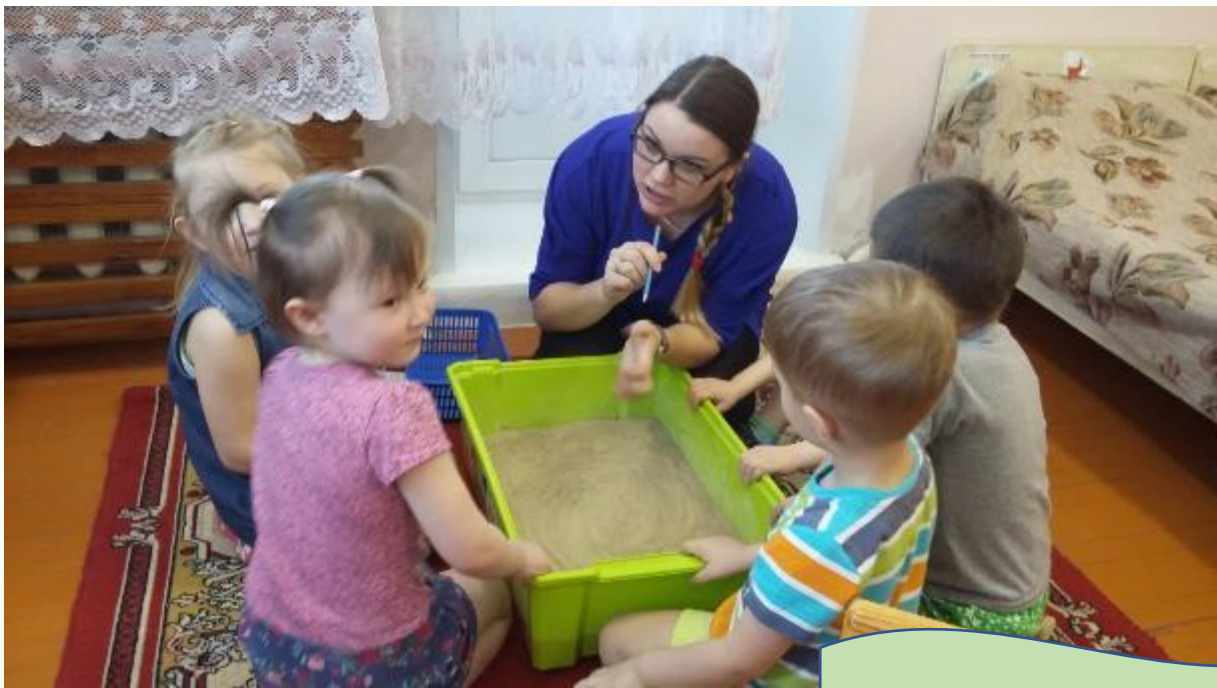
Ветер в Песочной стране