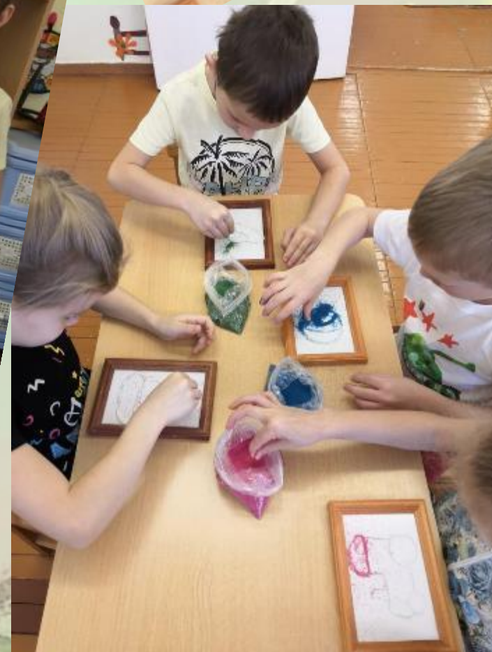
Создание песочных картин