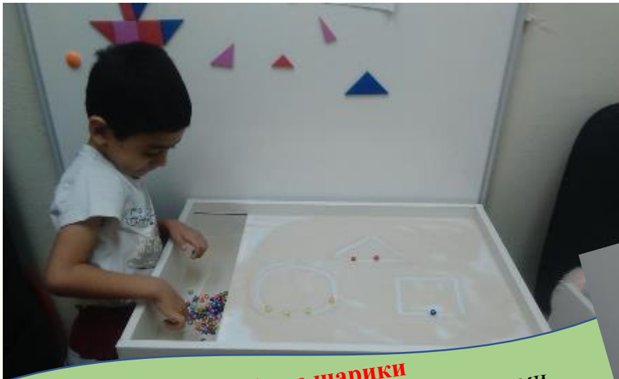
Волшебные шарики Украшение геометрической фигуры шариками определенного цвета