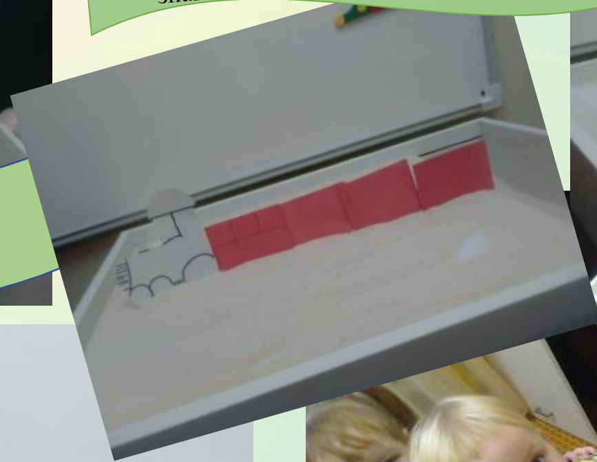
«Веселые вагончики» Игры на умение различать предметы по цветам; знакомство с геометрическими фигурами