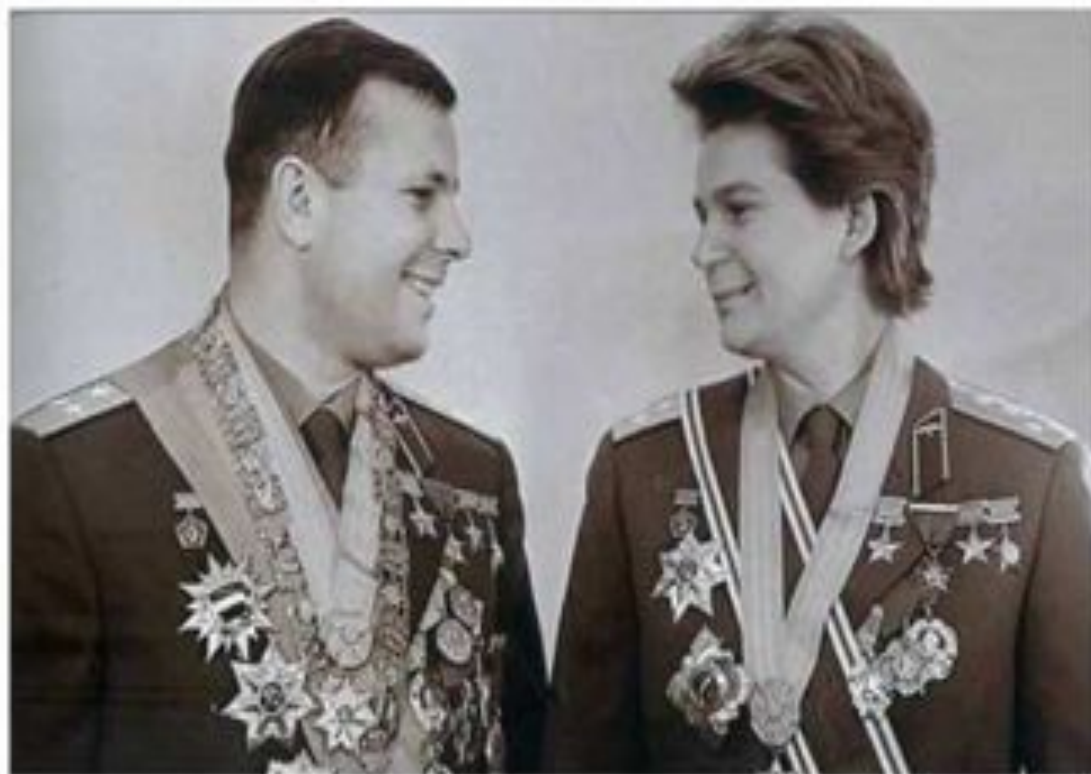
Ю.Гагарин и В. Терешкова.