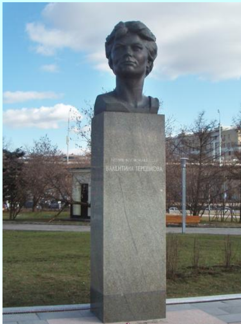
Памятник Валентине Терешковой в Москве