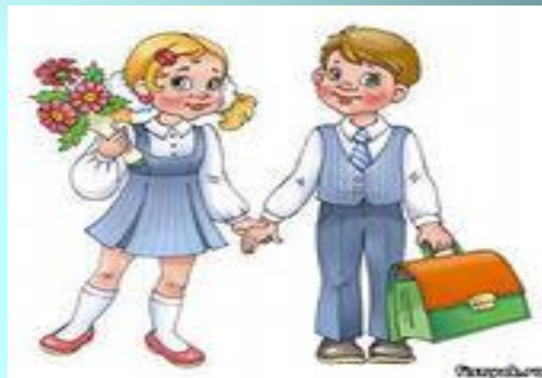
2 а класс

В результате исследования мы выяснили, что в нашем классе 12 мужских имен, а женских 6.