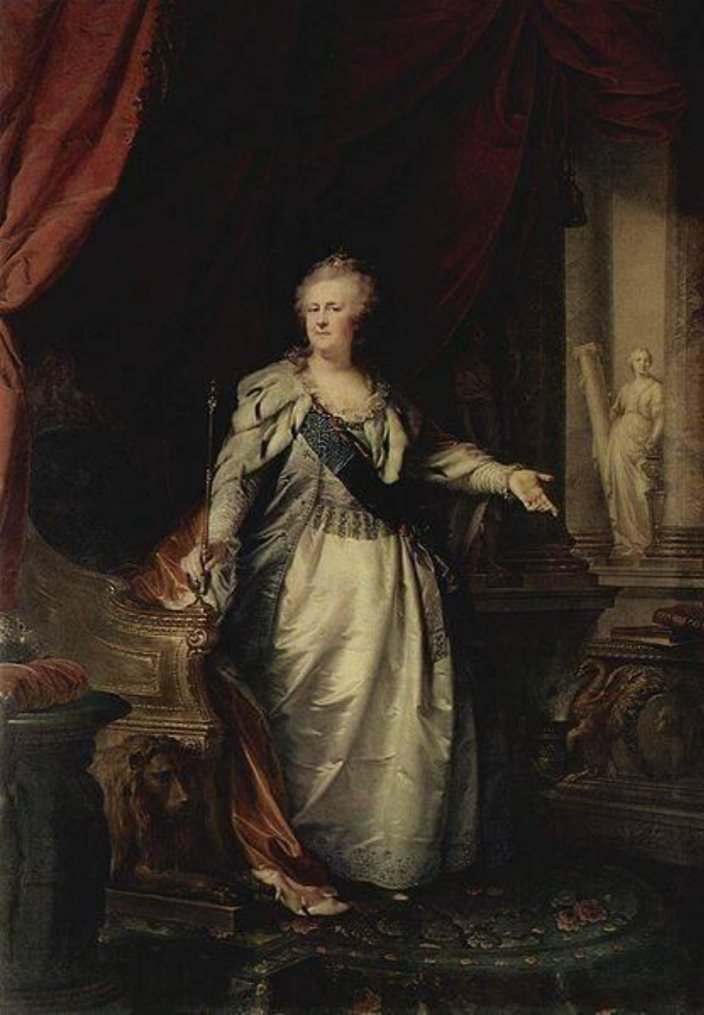
Портрет работы Лампи, 1793 г.