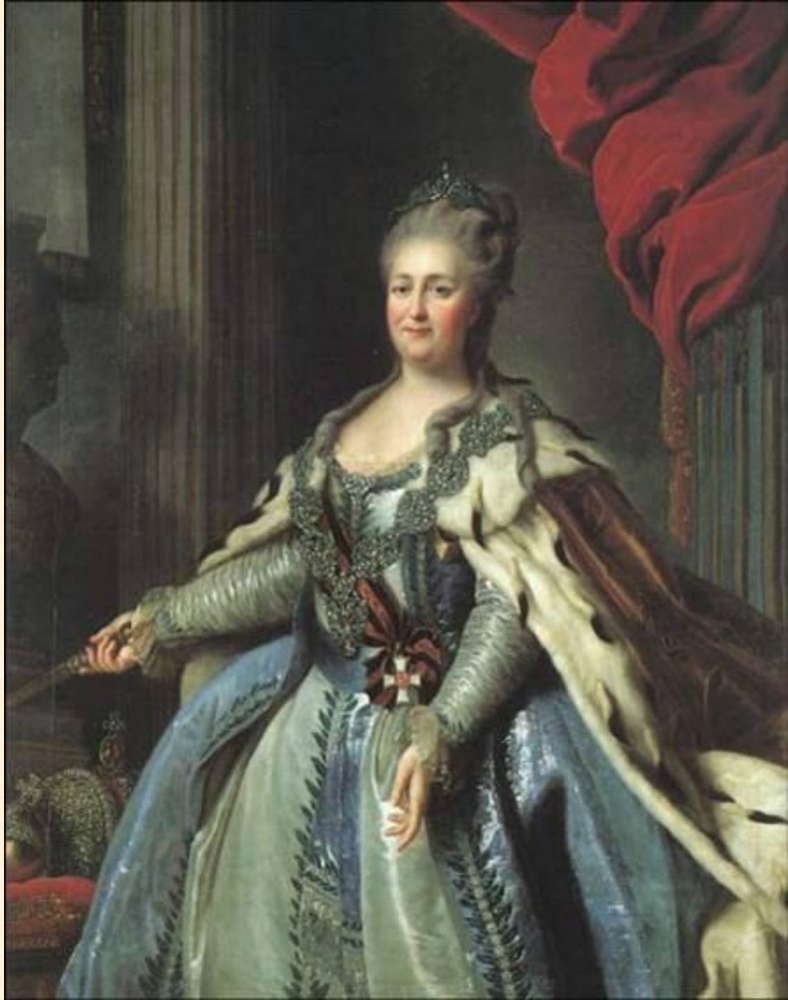
Фрагмент картины Ф.Рокотова, 1770 г.