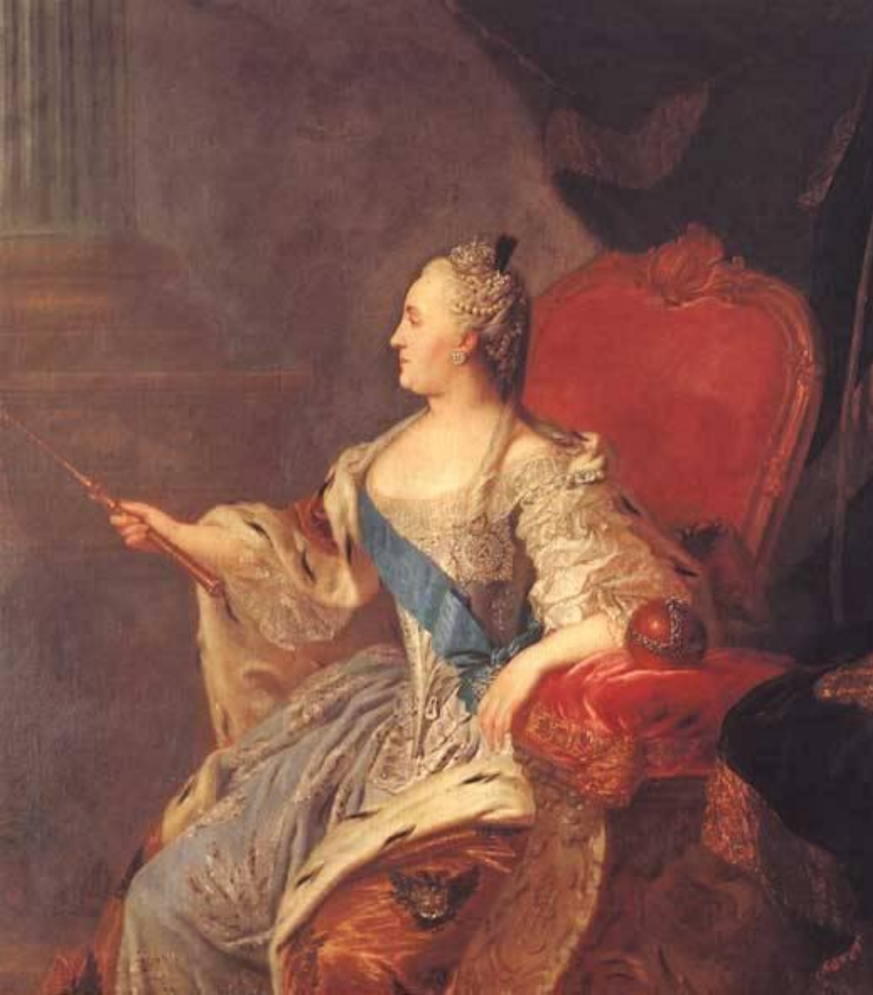
Портрет Екатерины Второй, 1763 г., Ф. Рокотов