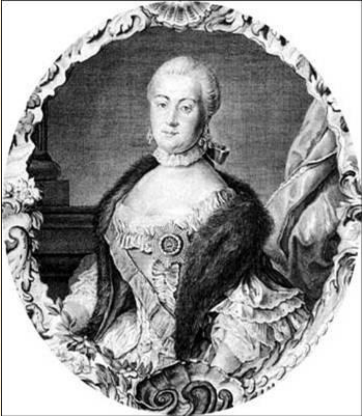
Екатерина II гравюра резцом, конец XVIII века