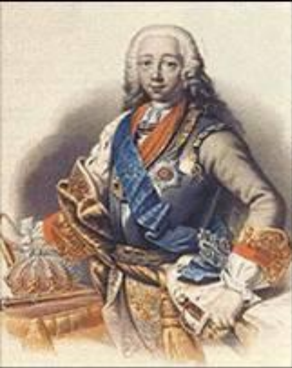
Великий князь Петр Федорович будущий император Петр III