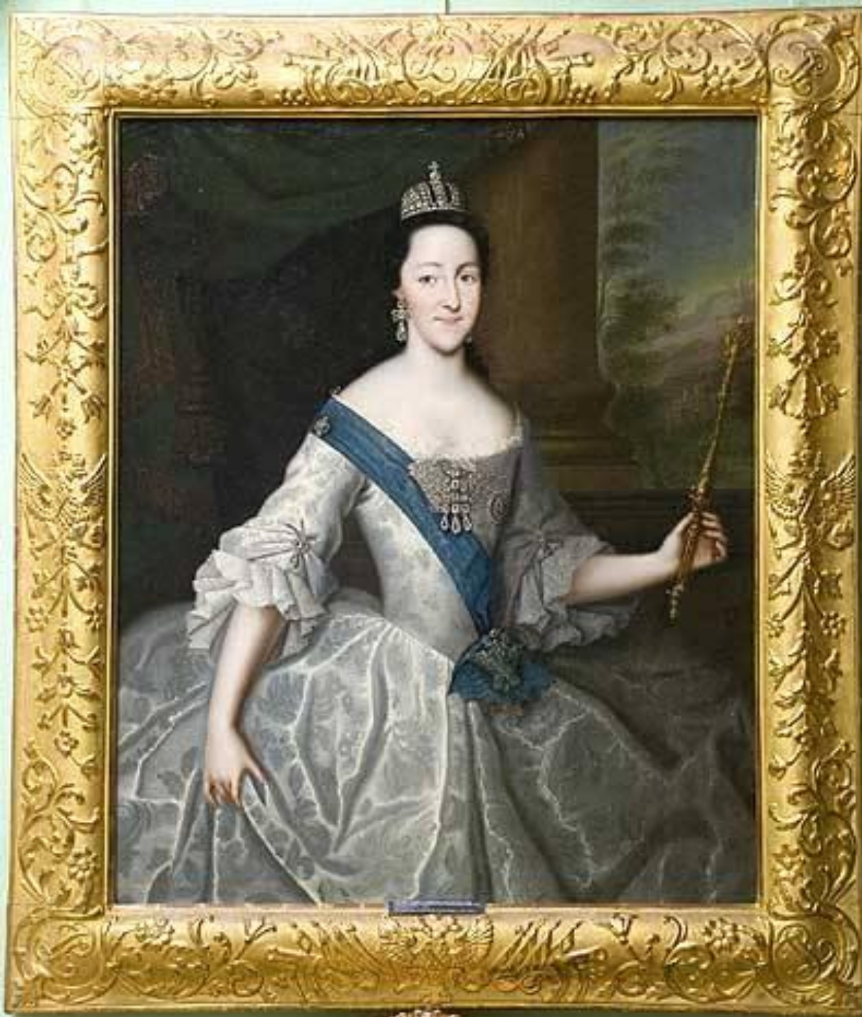
Екатерина Алексеевна примерно 1758 год