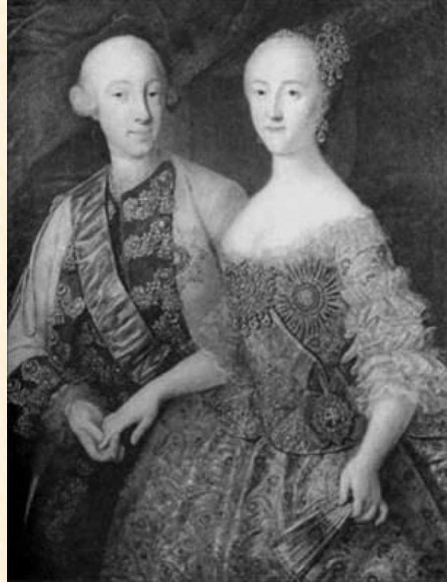
Великий князь Петр Федорович и Великая княгиня Екатерина Алексеевна