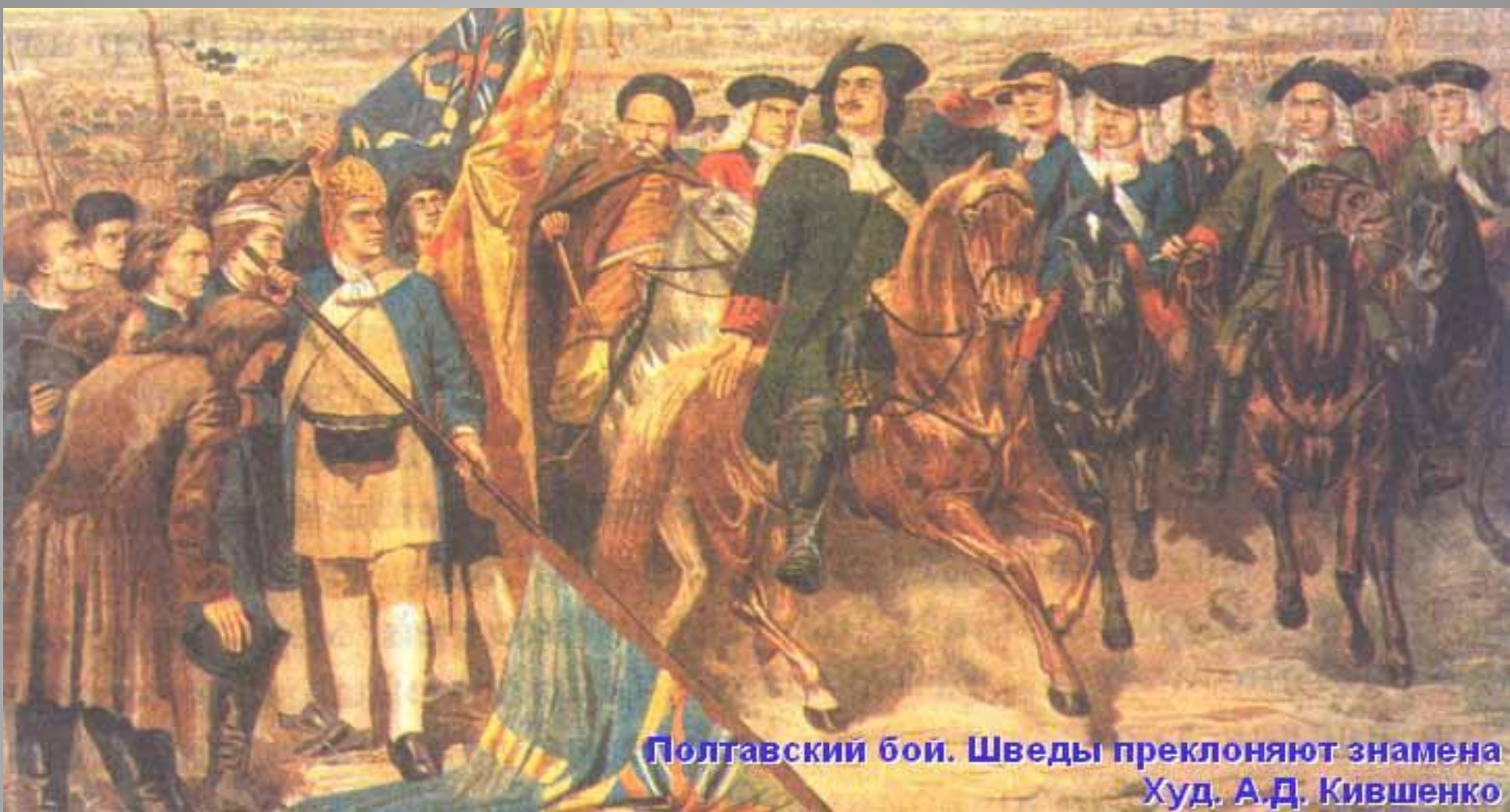
Полтавский бой. Шведы преклоняют знамена Худ. А.Д. Кившенко

Победа под Полтавой предопределила победоносный для России исход Северной войны 1700-1721гг. и поставила Россию в ряд великих европейских держав.