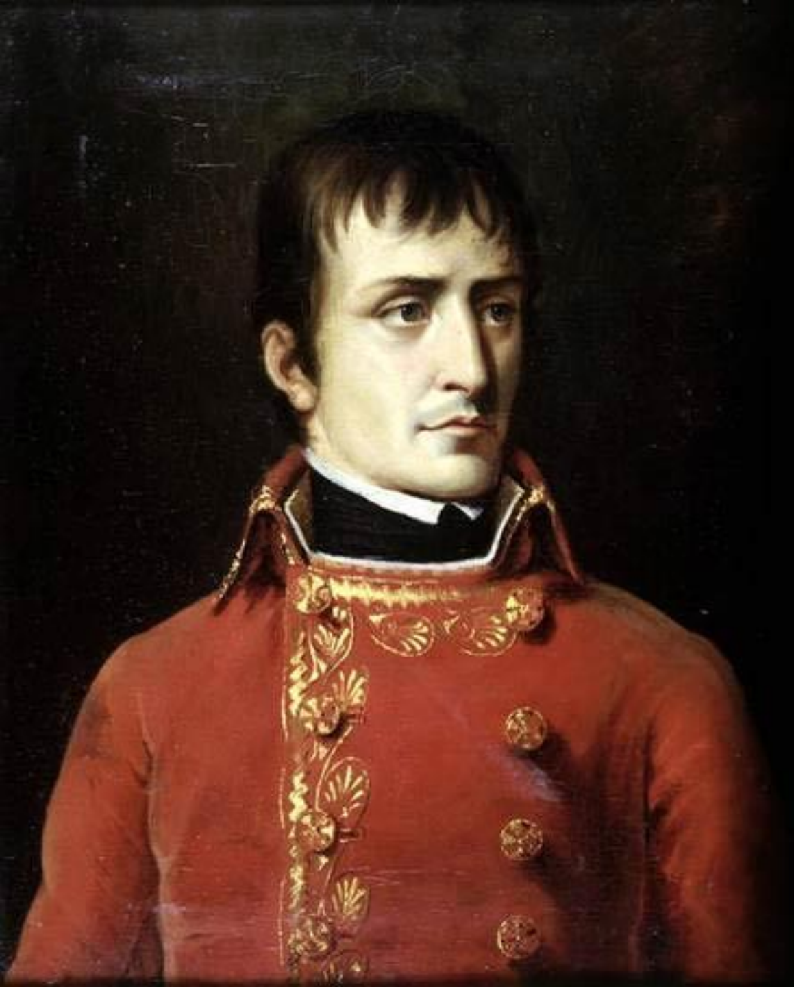
НАПОЛЕОН БОНАПАРТ (1769 – 1821 гг)