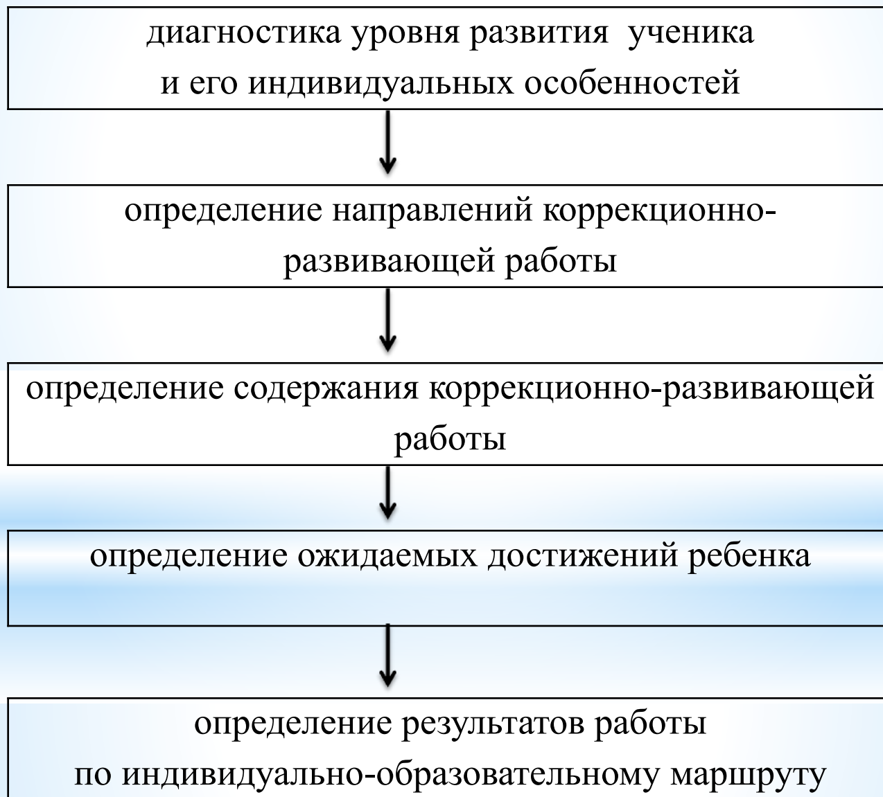
Схема построения индивидуального образовательного маршрута детей с ОВЗ в классах КРО