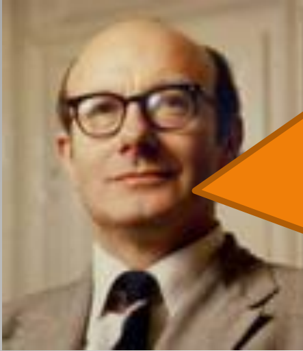
Колин Ренфрю (1937)

Праиндоевропейский язык существовал раньше, чем принято считать, примерно в неолите, в 7-6 тыс. до н. э. в Анатолии (памятником индоевропейцев считается Чатал-Хююк), после чего в 6 тыс. индоевропейские языки пересекли Босфор и распространились в Юго-Восточной Европе.