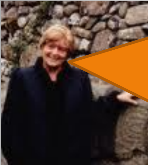
Мария Гимбутас (1923-1994)

Прародиной индоевропейцев являются волжские и причерноморские степи. Постепенно различные ветви индоевропейцев волнами мигрировали в разные стороны от прародины. Дольше всех изначальный ареал занимали предки болтов и славян.