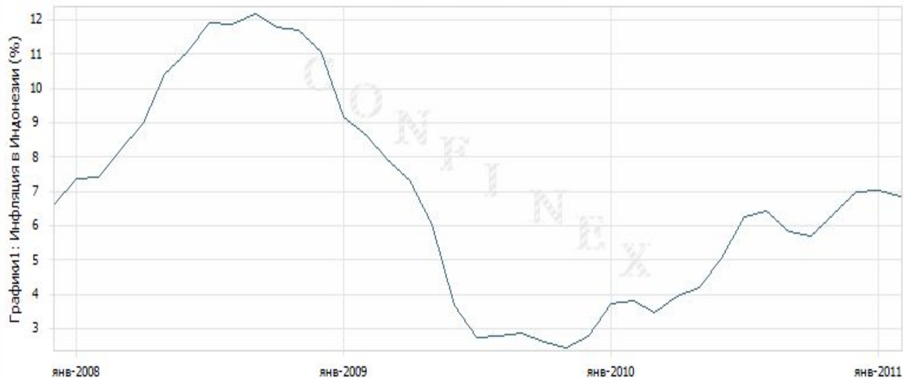
Графики1: — Инфляция в Индонезии (%)