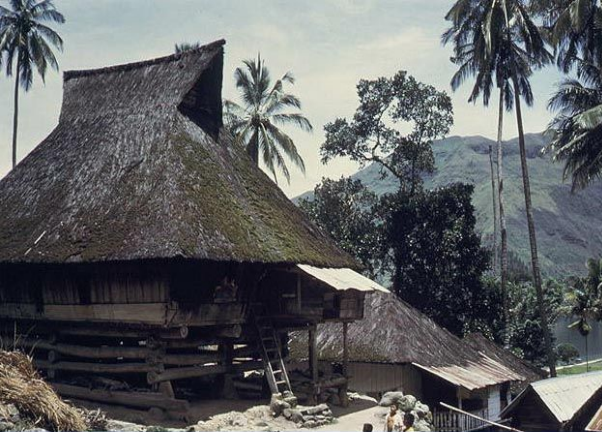
Индонезия. Традиционное жилище.