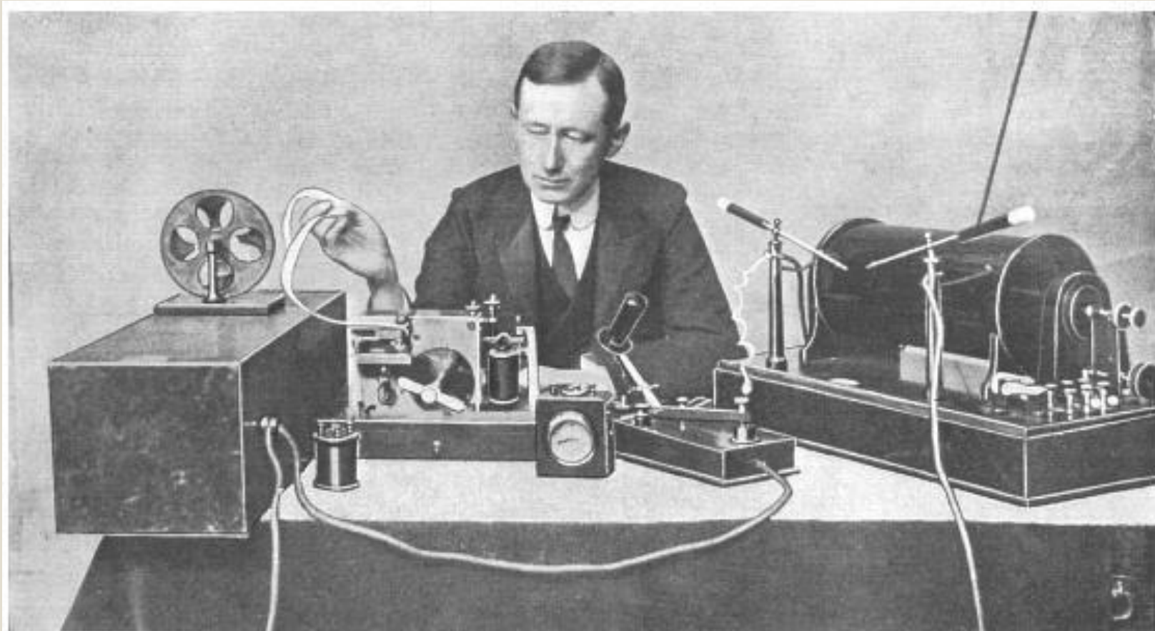
MARCONI READING A MESSAGE