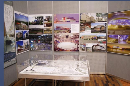
Фото залов Информационного центра до реконструкции