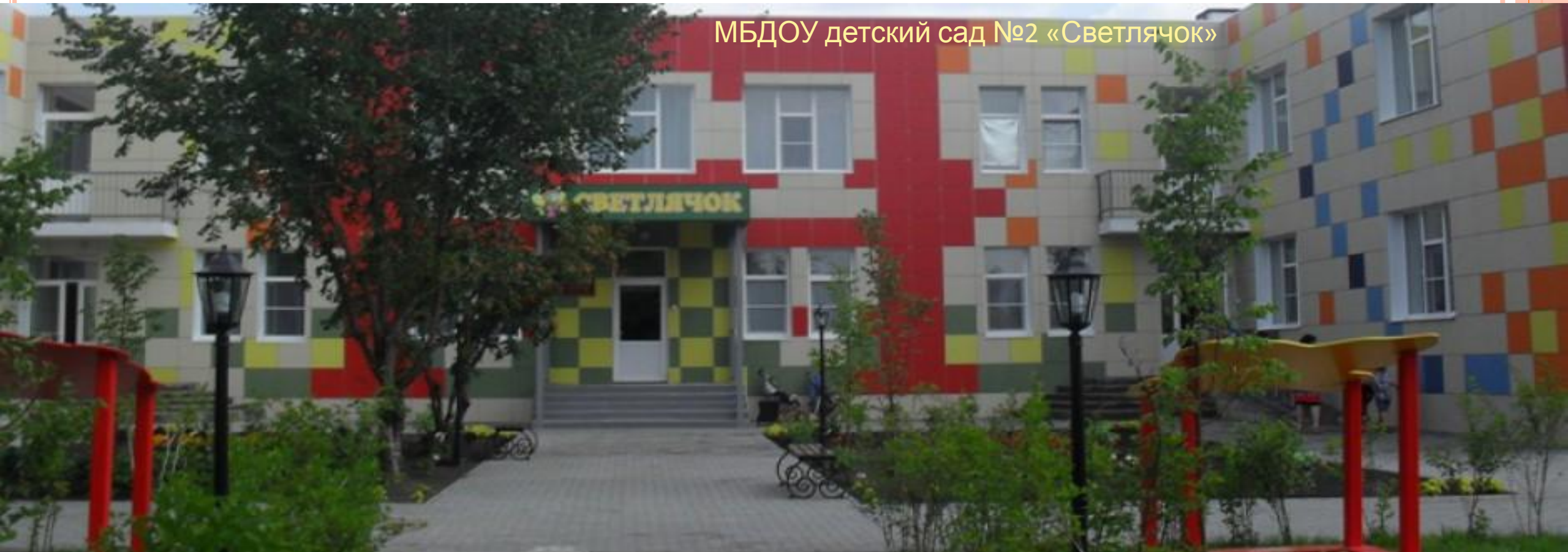
МБДОУ детский сад №2 «Светлячок»

«ПРЕДОСТАВЬТЕ ЧЕЛОВЕКУ ВСЕ ТЕ ПРАВА, КОТОРЫМИ БЫ ВЫ ХОТЕЛИ ОБЛАДАТЬ САМИ» РОБЕРТ ИНГЕРСОЛЛИ