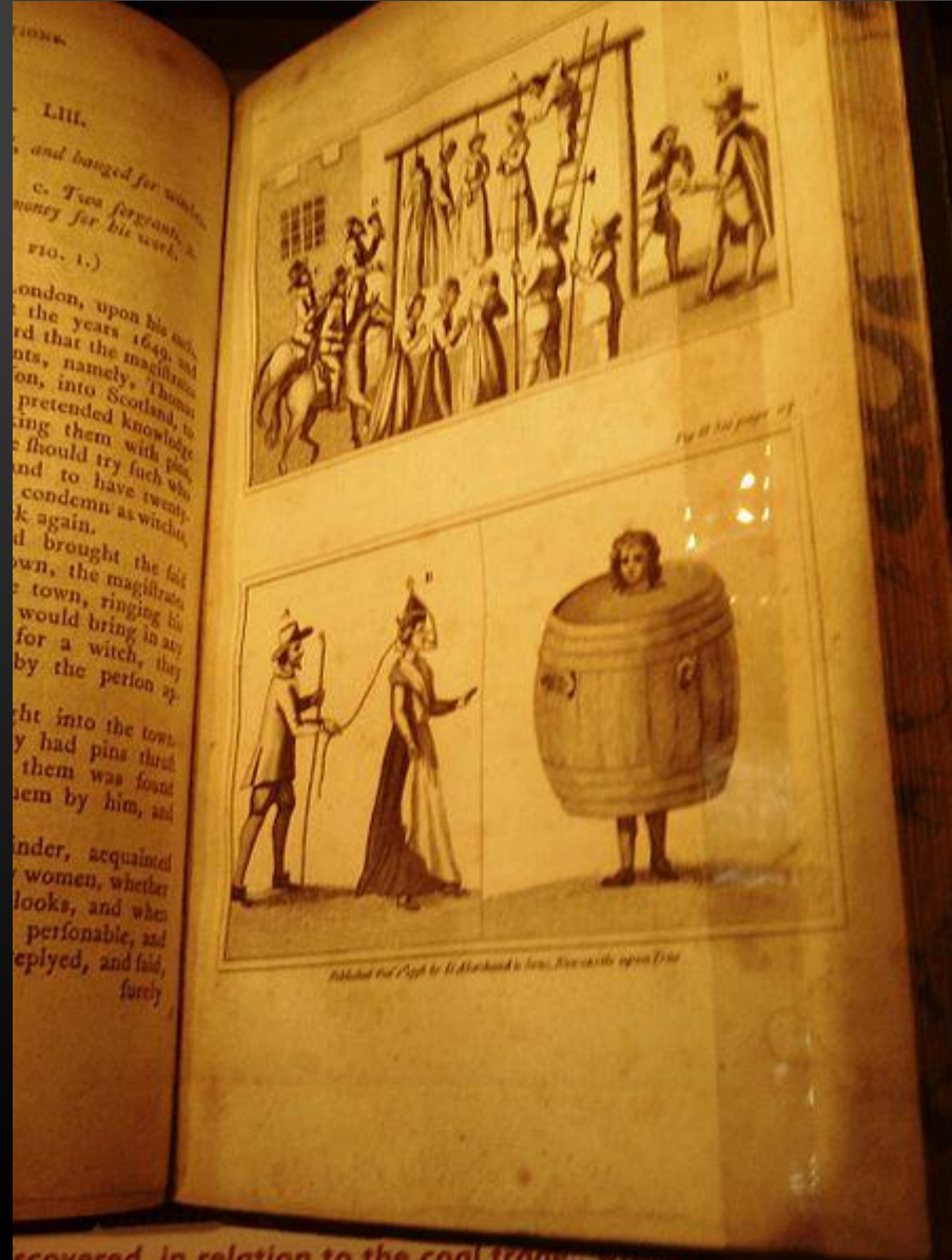
discovered in relation to the coal trade...