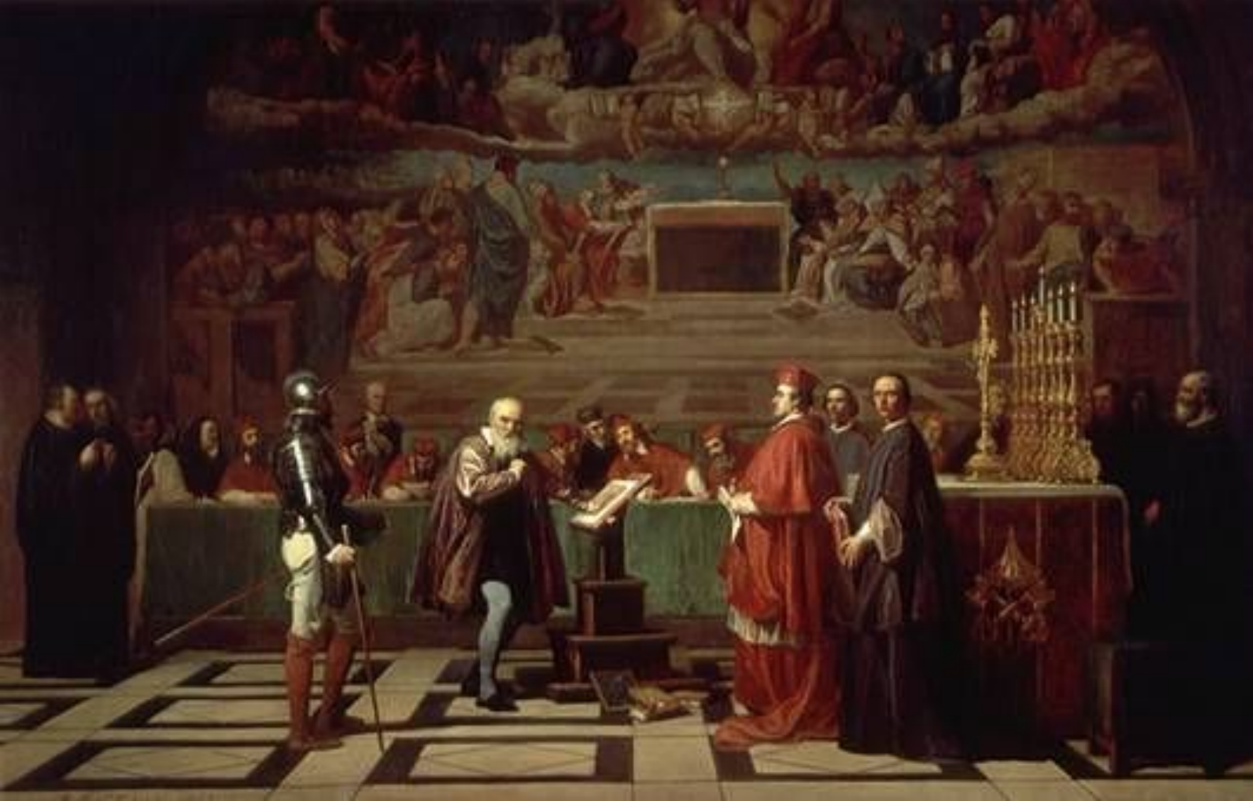
ГАЛИЛЕО ГАЛИЛЛЕЙ ПЕРЕД СУДОМ ИНКВИЗИЦИИ. КАРТИНА ЖОЗЕФА-НИКОЛЯ РОБЕР-ФЛЁРИ