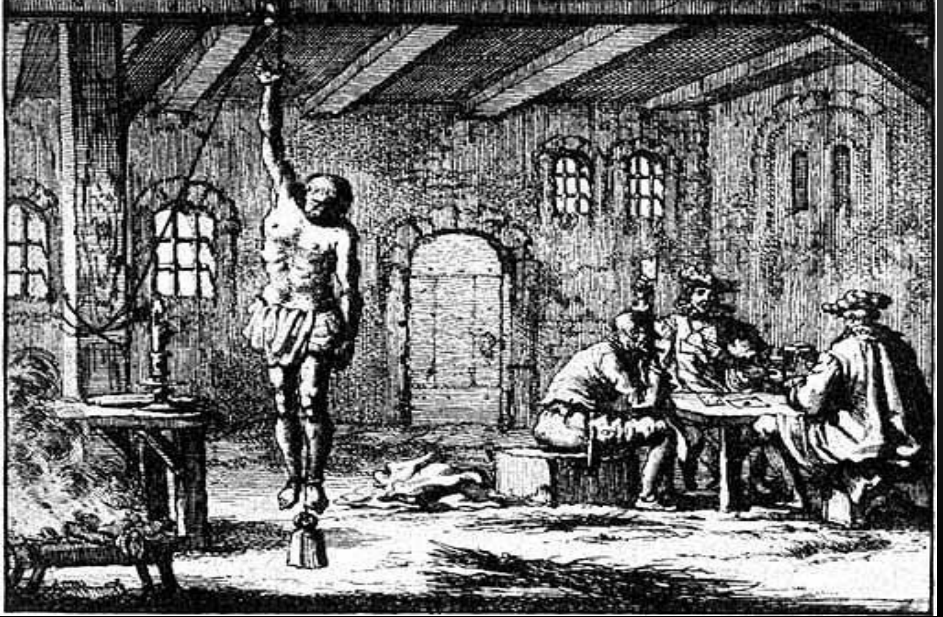
Ян Луйкен. В застенке инквизиции.