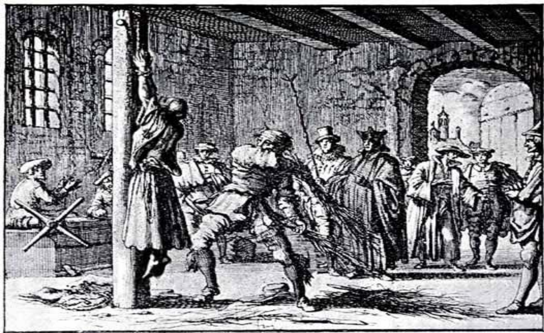
ЯН ЛЮЙКЕН. «ДОПРОС УРСУЛЫ, ЖЕНЫ УЧИТЕЛЯ В 1570 ГОДУ». (ПЫТКА БИЧЕВАНИЯ ПЛЕТЬЮ).