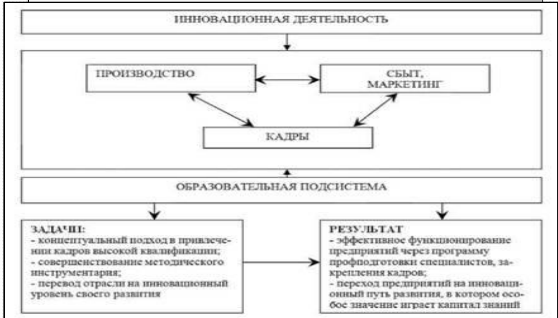
Схема взаимосвязи образовательной подсистемы с инновационной деятельностью развития пищевой промышленности