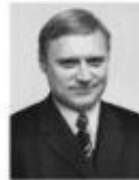
Михаил Михайлович КАСЬЯНОВ