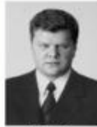
Сергей Сергеевич МИТРОХИН