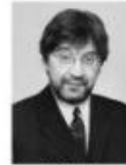
Юрий Юлианович ШЕВЧУК