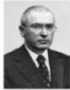
Михаил Борисович ХОДОРКОВСКИЙ