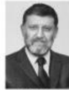
Сергей Борисович ПАРХОМЕНКО