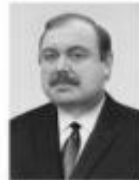
Геннадий Владимирович ГУДКОВ