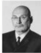
Григорий Шалович АКУНИН