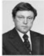
Григорий Алексеевич ЯВЛИНСКИЙ