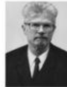
Эдуард Веняминович ЛИМОНОВ