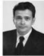
Илья Валерьевич ЯШИН