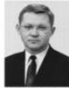
Владимир Александрович РЬЖКОВ