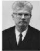
Эдуард Веняминович ЛИМОНОВ