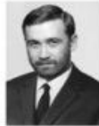
Илья Владимирович ПОНОМАРЕВ