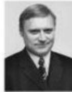
Михаил Михайлович КАСЬЯНОВ