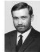
Илья Владимирович ПОНОМАРЕВ