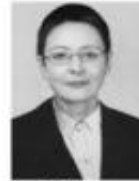
Ирина Муздовна ХАКАМАДА