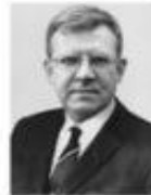
Алексей Леонидович КУДРИН