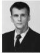
Михаил Дмитриевич ПРОХОРОВ