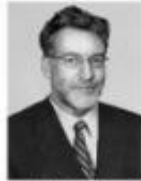
Артеми Кивович ТРОИЦКИЙ