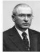
Михаил Борисович ХОДОРКОВСКИЙ