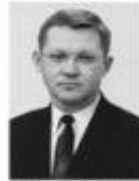
Владимир Александрович РЬЖКОВ