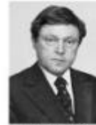
Григорий Алексеевич ЯВЛИНСКИЙ