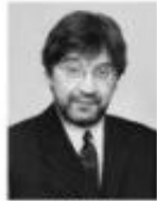
Юрий Юлианович ШЕВЧУК