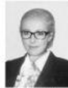
Ксения Анатолевна СОБЧАК