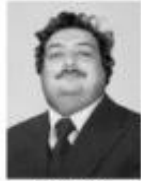
Дмитрий Львович БЫКОВ