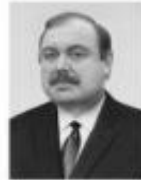
Геннадий Владимирович ГУДКОВ