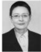
Ирина Музувна ХАКАМАДА