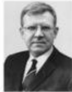
Алексей Леонидович КУДРИН