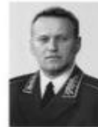
Алексей Анатолевич НАВАЛЬНЫЙ