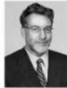
Артемий Кивович ТРОИЦКИЙ