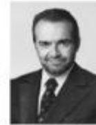
Виктор Анатолевич ШЕНДЕРОВИЧ