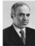
Гарри Кимович КАСПАРОВ