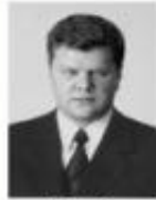
Сергей Сергеевич МИТРОХИН