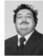
Дмитрий Львович БЫКОВ