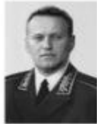
Алексей Анатолевич НАВАЛЬНЫЙ