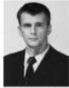
Михаил Дмитриевич ПРОХОРОВ