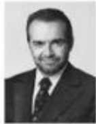
Виктор Анатолевич ШЕНДЕРОВИЧ