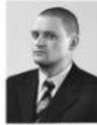
Сергей Станиславович УДАЛЬЦОВ