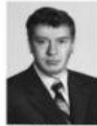
Борис Ефимович НЕМЦОВ