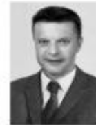
Леонид Геннадьевич ПАРФЕНОВ