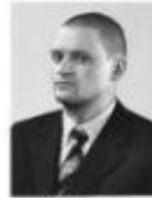
Сергей Станиславович УДАЛЬЦОВ