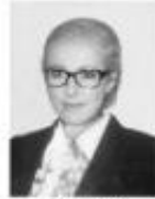
Ксения Анатолевна СОБЧАК