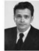
Илья Валерьевич ЯШИН