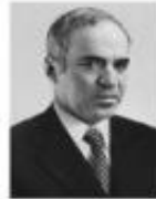
Гарри Кимович КАСПАРОВ