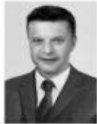
Леонид Геннадьевич ПАРФЕНОВ