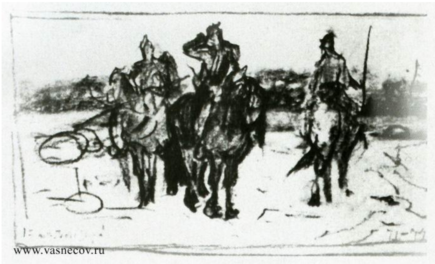
Первый набросок картины «Богатыри», 1871—1874 г.