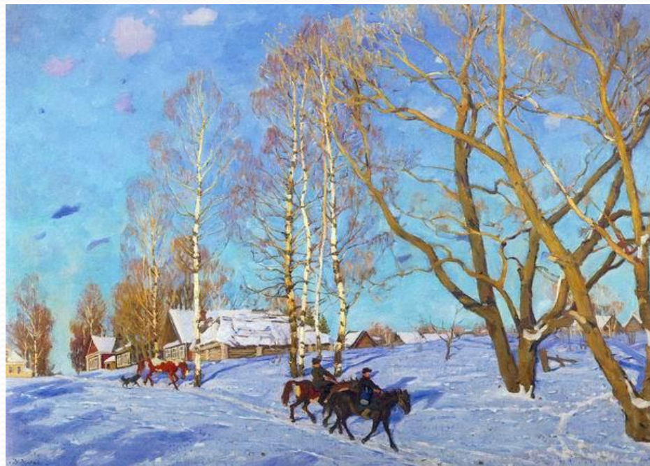
Константин Юон. Мартовское солнце.