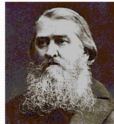
А. Н. Плещеев