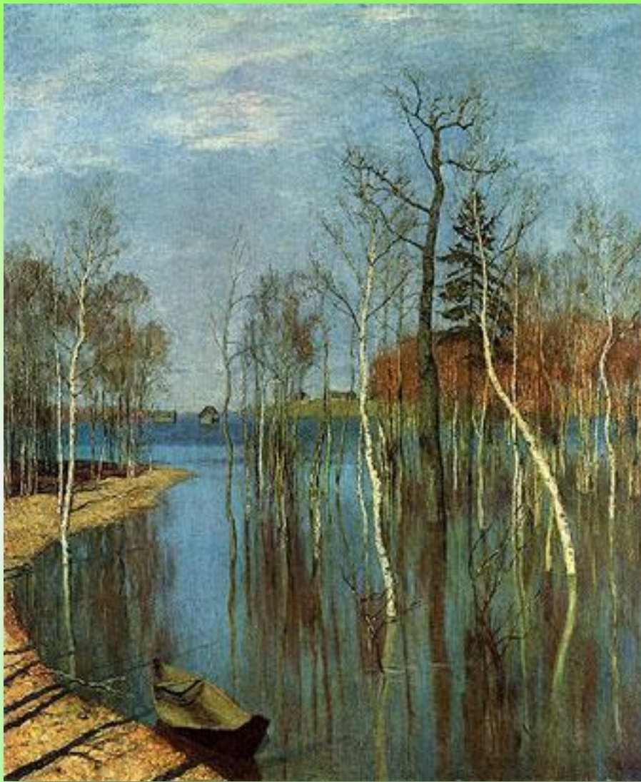
И. Левитан «Большая вода»

А воды уж весной шумят — Бегут и будят сонный брег, Бегут и блещут и гласят... Они гласят во все концы: «Весна идет, весна идет! Мы молодой весны гонцы, Она нас выслала вперед!» Весна идет, весна идет! И тихих, теплых майских дней Румяный, светлый хоровод Толпится весело за ней!