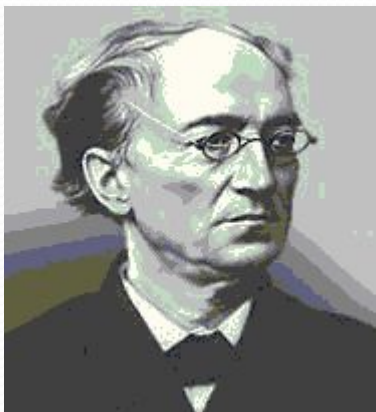
Ф. И. Тютчев