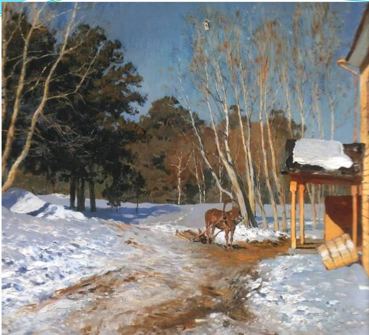
Исаак Левитан. Март.

Весна! Весна по всем приметам, Куда теперь я ни взгляну. Весна с улыбкой и приветом... Затем жить стоит в мире этом, Чтоб видеть русскую Весну!