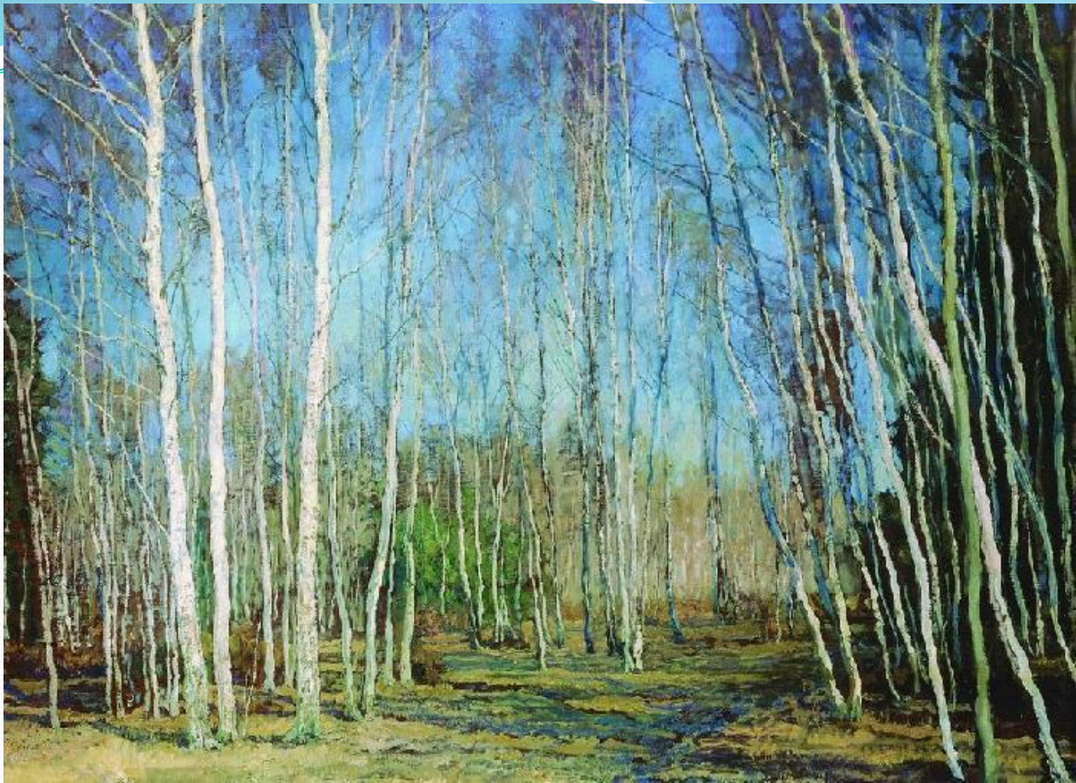
Василий Бакшеев. Голубая весна.