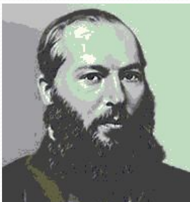
А. А. Фет