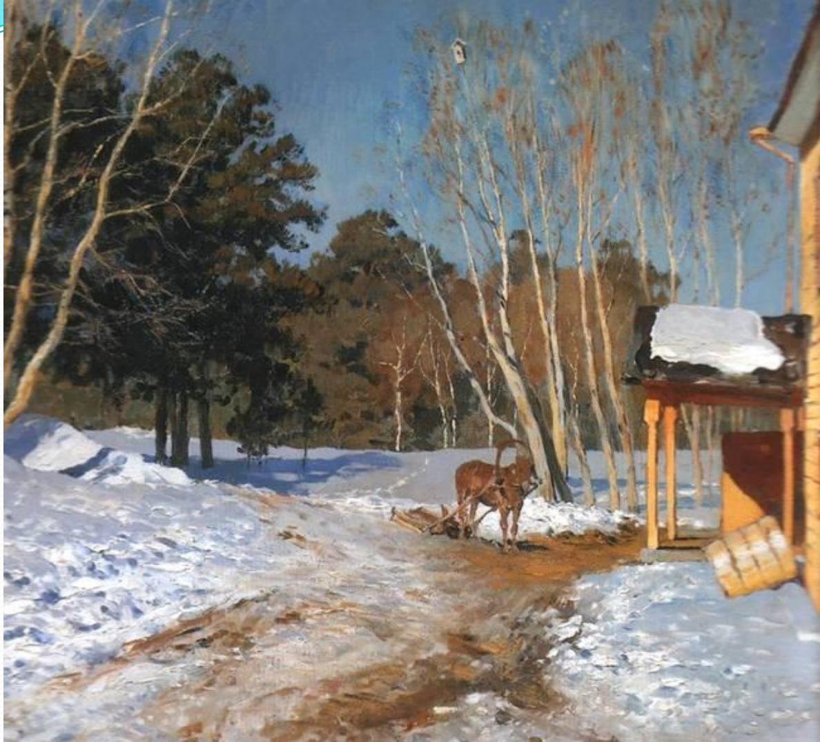
Исаак Левитан. Март.

Весна! Весна по всем приметам, Куда теперь я ни взгляну. Весна с улыбкой и приветом... Затем жить стоит в мире этом, Чтоб видеть русскую Весну!