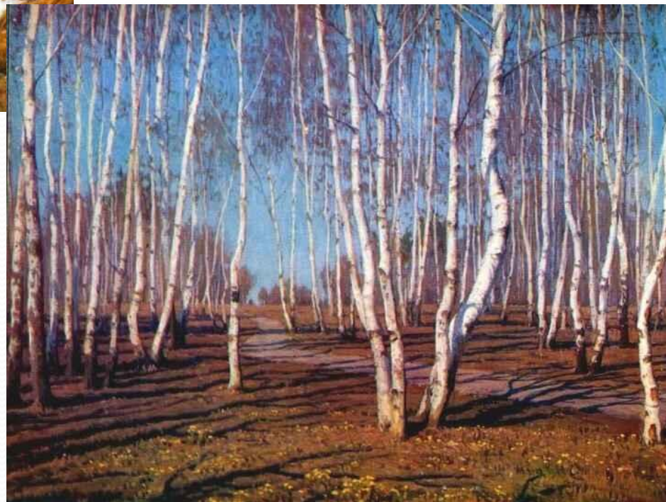
Б. Щербаков. Апрельское солнце.