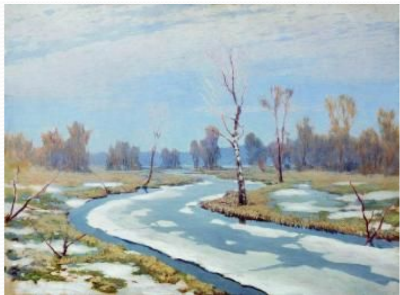
А. И. Куинджи "Ранняя весна"