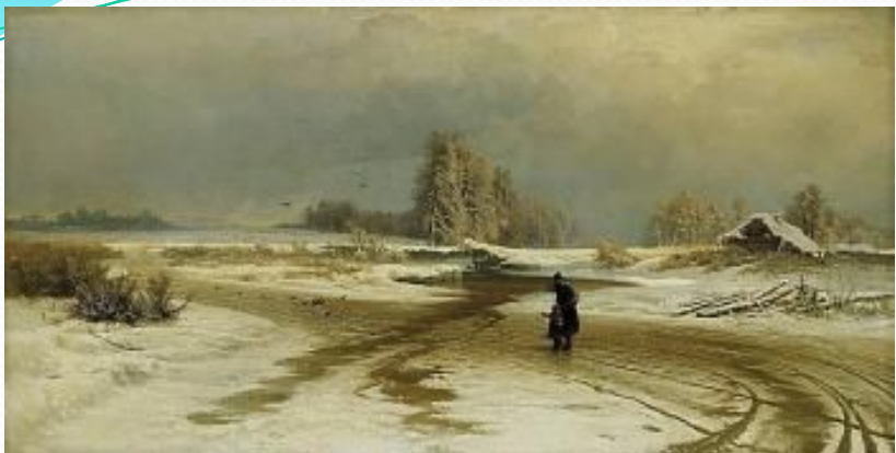
картина Ф. А. Васильева "Оттепель"