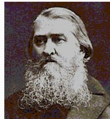
А. Н. Плещеев