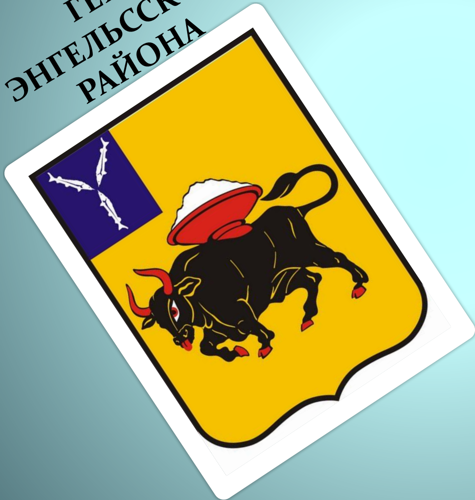
ГЕРБ ЭНГЕЛЬСКОГО РАЙОНА