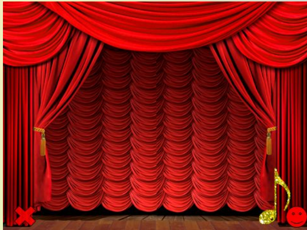
Слайд 3 (после открытия полученного ответа)

Рефлексия: вопрос-ответ: Вам понравилась игра? Какие инструменты вы запомнили? Что не понравилось?