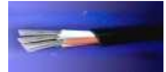
Бердянський кабельний завод