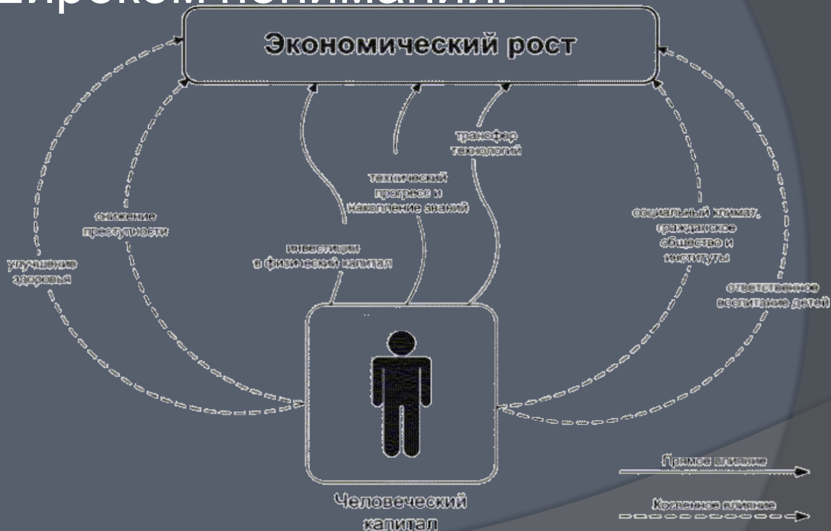
Рисунок 1. Каналы влияния человеческого капитала на экономический рост.