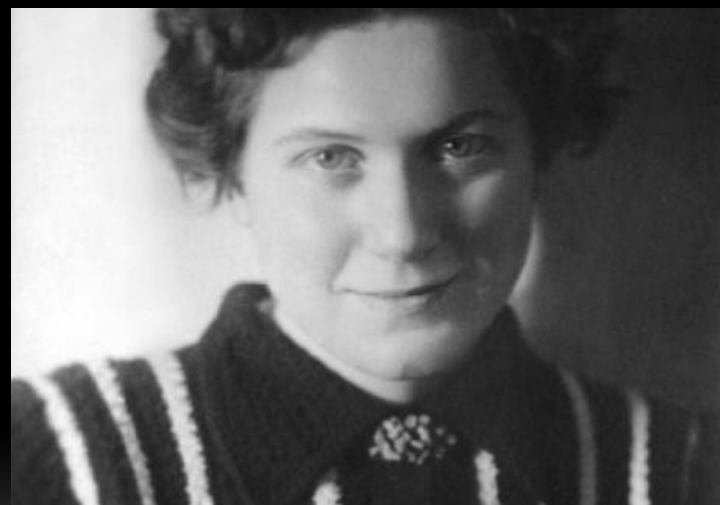
Светлана Аллилуева на отдыхе (1952 год)

Дочь Сталина Светлана Аллилуева 6 марта 1967 года попросила политического убежища в посольстве Соединённых Штатов в Дели и в том же году переехала в США.