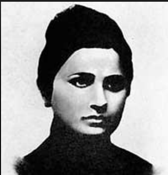
Екатерина (Като́) Сванидзе

Первой женой Сталина стала Екатерина Сванидзе, брат которой учился вместе с ним в Тифлисской семинарии. Бракосочетание состоялось либо в 1904 году (до первой ссылки в 1903 году), либо в 1904 году (после ссылки), но спустя три года жена умерла от туберкулёза. По воспоминаниям современников она молилась ночами о том, чтобы муж отказался от кочевой жизни профессионального революционера и занялся чем-то более основательным. Их единственный сын Яков попал в плен к немцам во время Второй мировой войны.