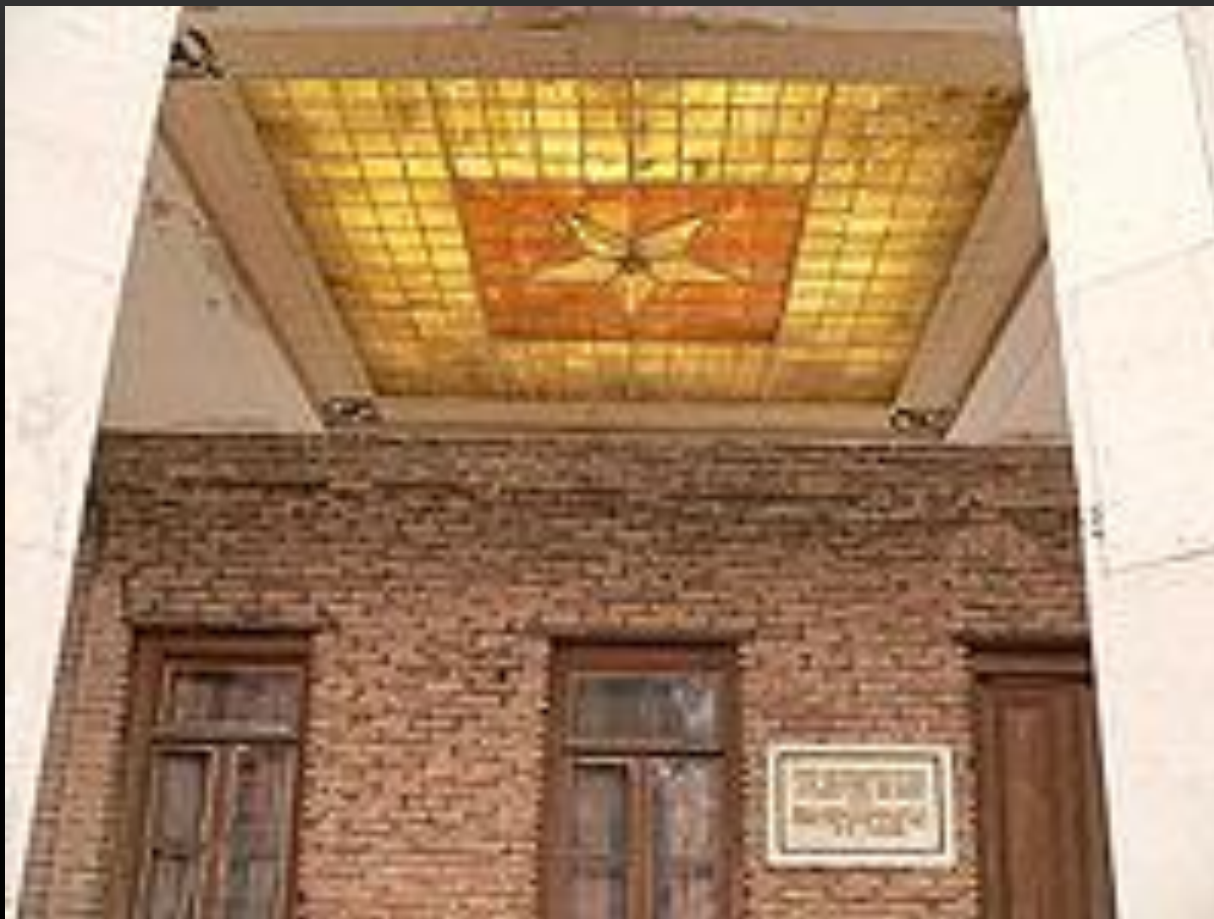
Дом где родился И. В. Сталин. Гори, Грузия