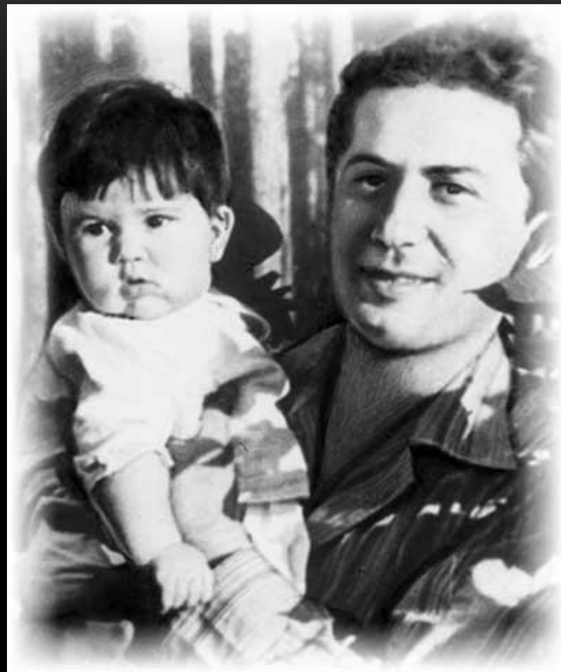
Уже со своим ребенком