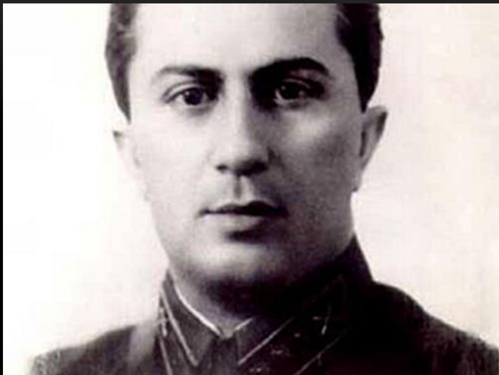
Яков Джугашвили, старший сын Сталина, от первого брака с Екатериной