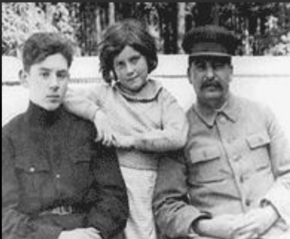
Сталин с детьми от второго брака: Василием (слева) и Светланой (в центре)