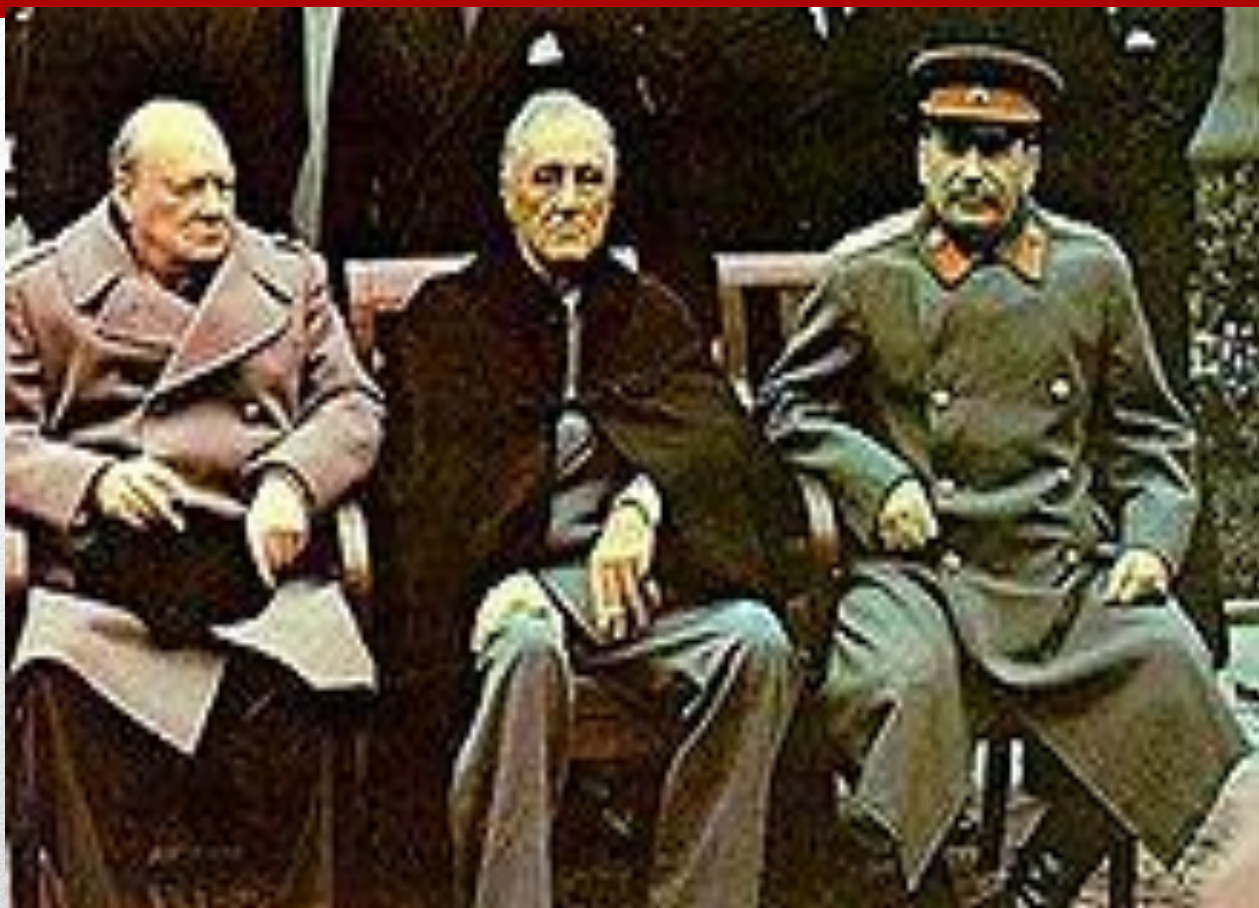
Черчилль, Рузвельт и Сталин на Ялтинской конференции