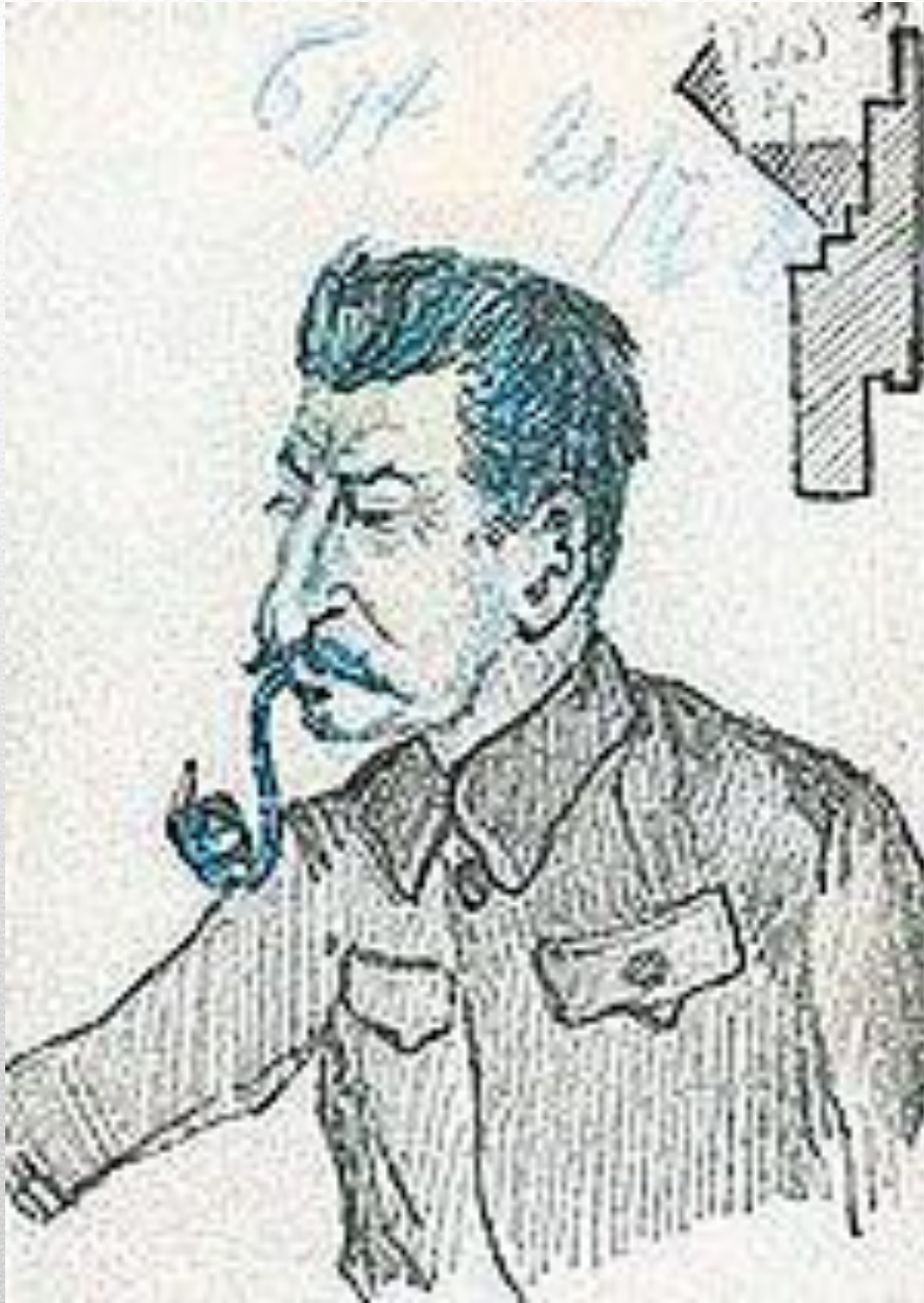
Сталин, шарж Бухарина, 1920-е