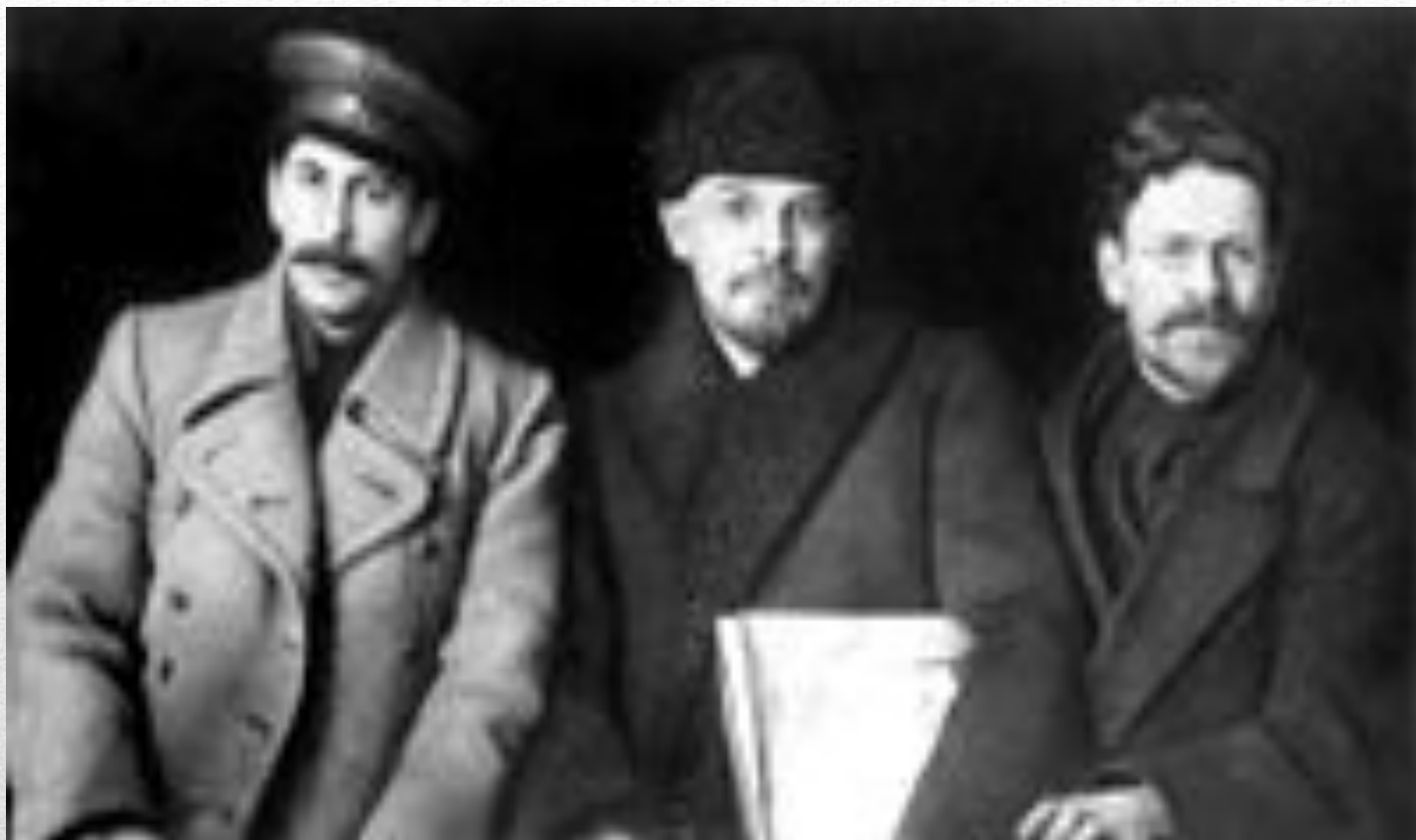
Сталин, Ленин и Калинин. 1919 год