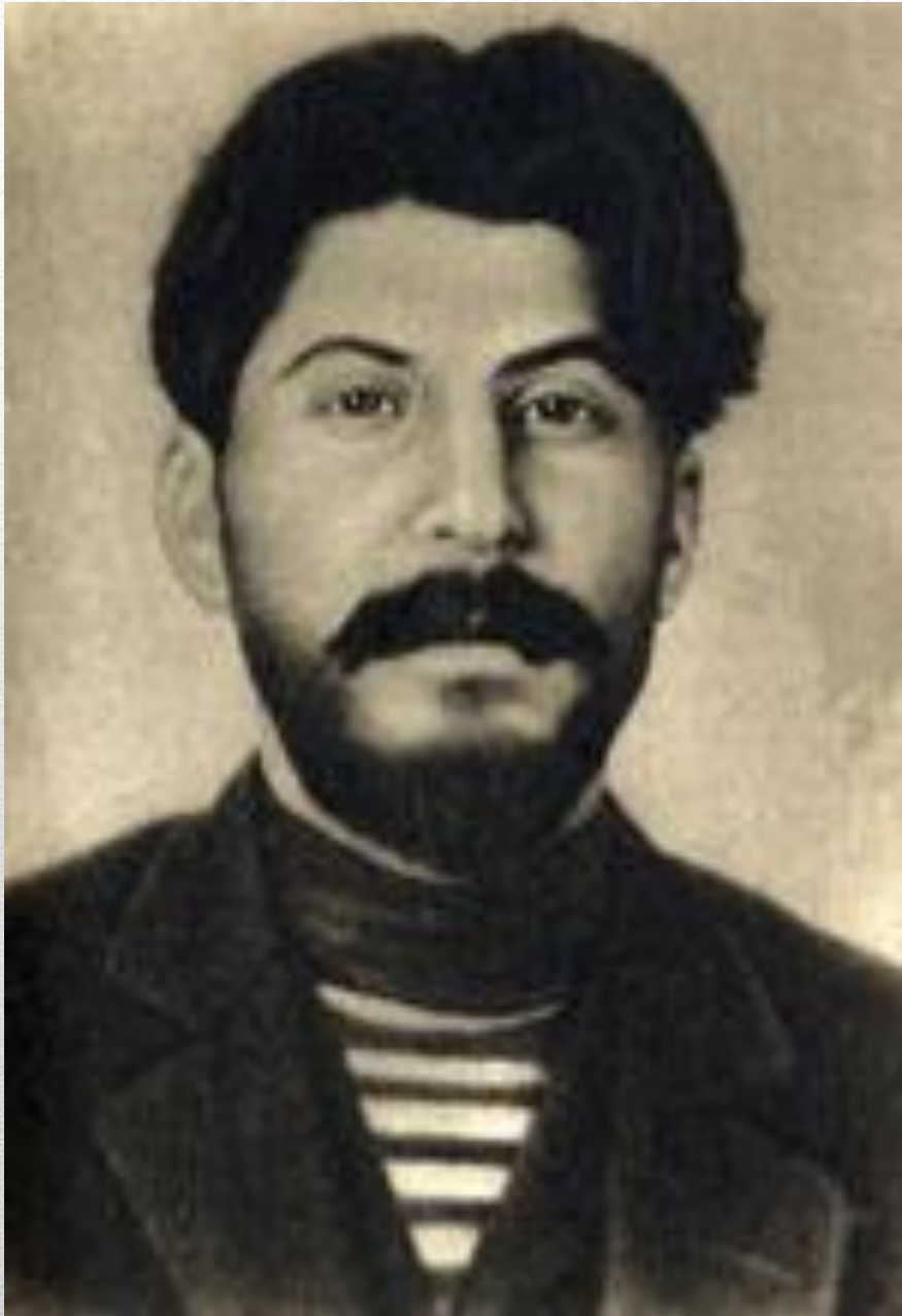
Сталин 1912 год