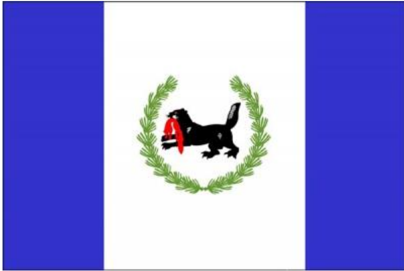
Флаг Иркутской области