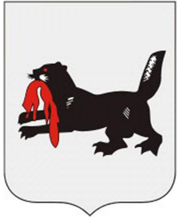
Герб Иркутской области