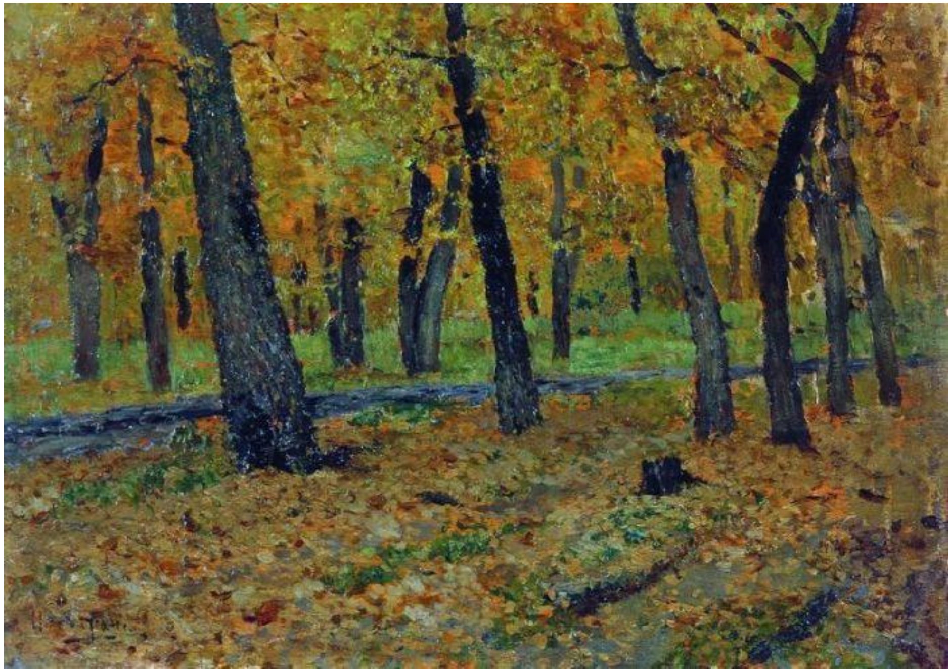
► Дубовая роща. Осень. 1880