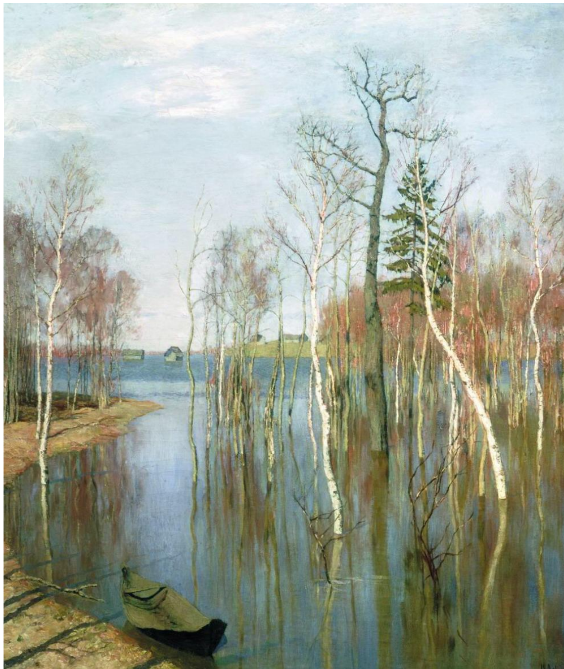
► Весна. Большая вода. 1897