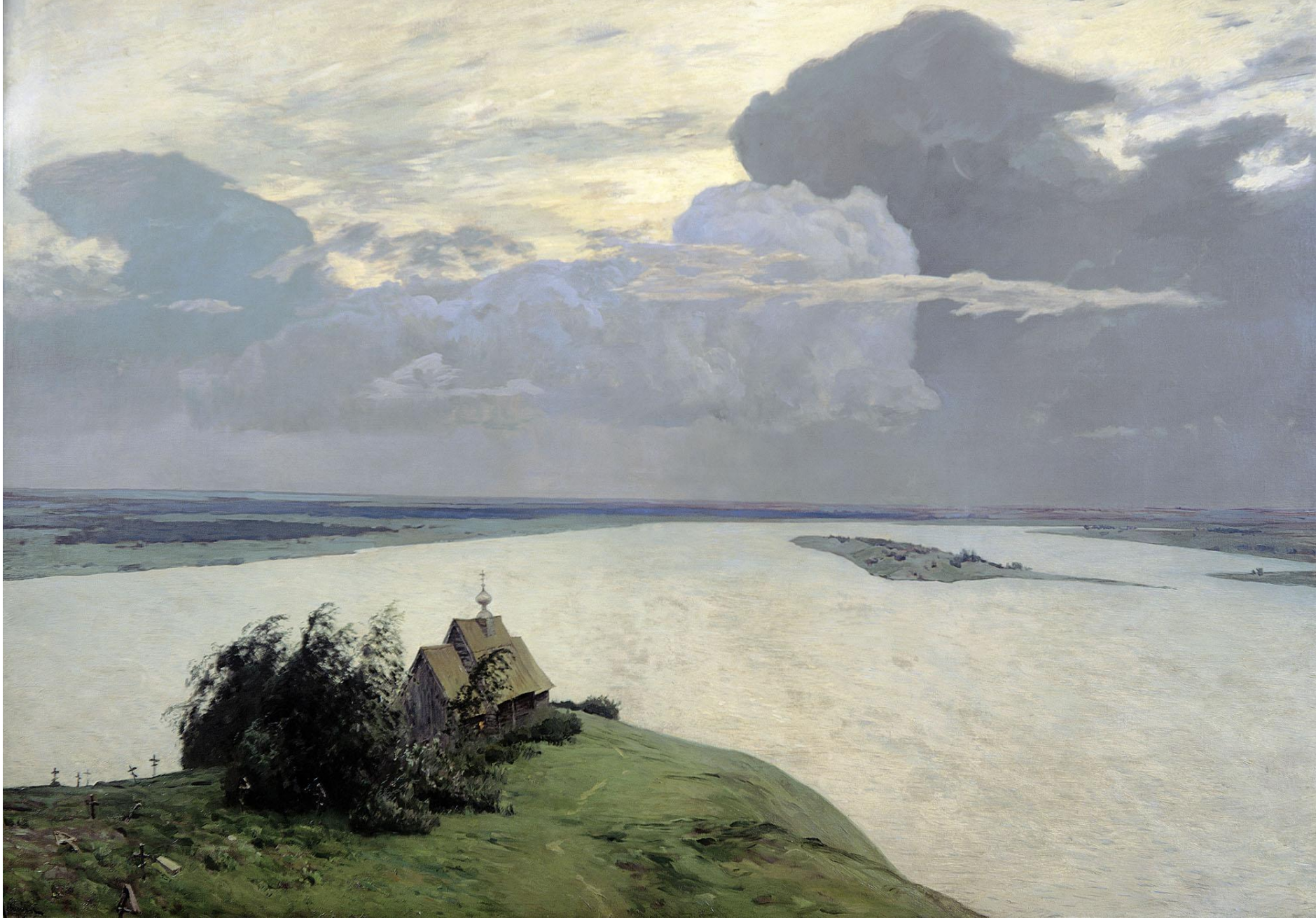
► Над вечным покоем. 1894