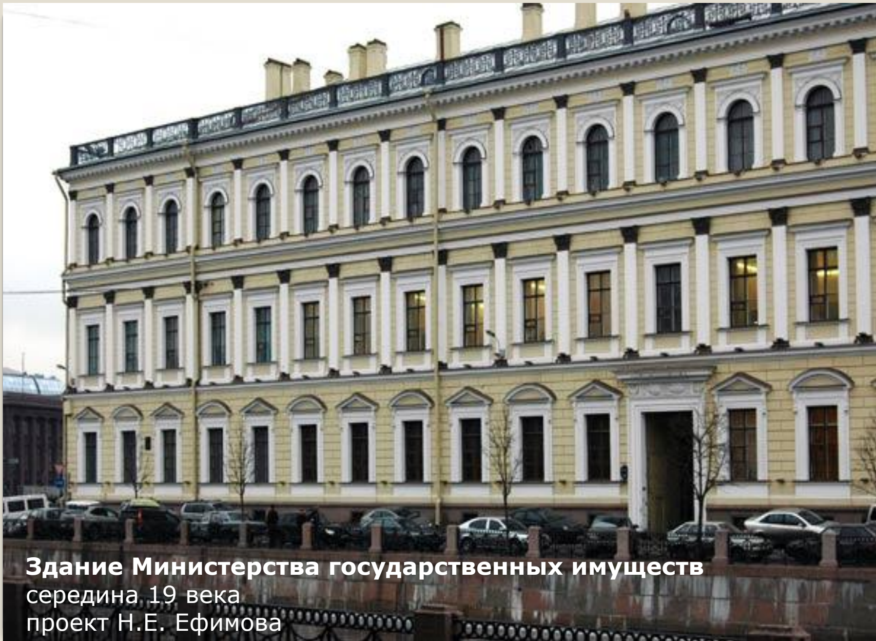
Здание Министерства государственных имуществ середина 19 века проект Н.Е. Ефимова