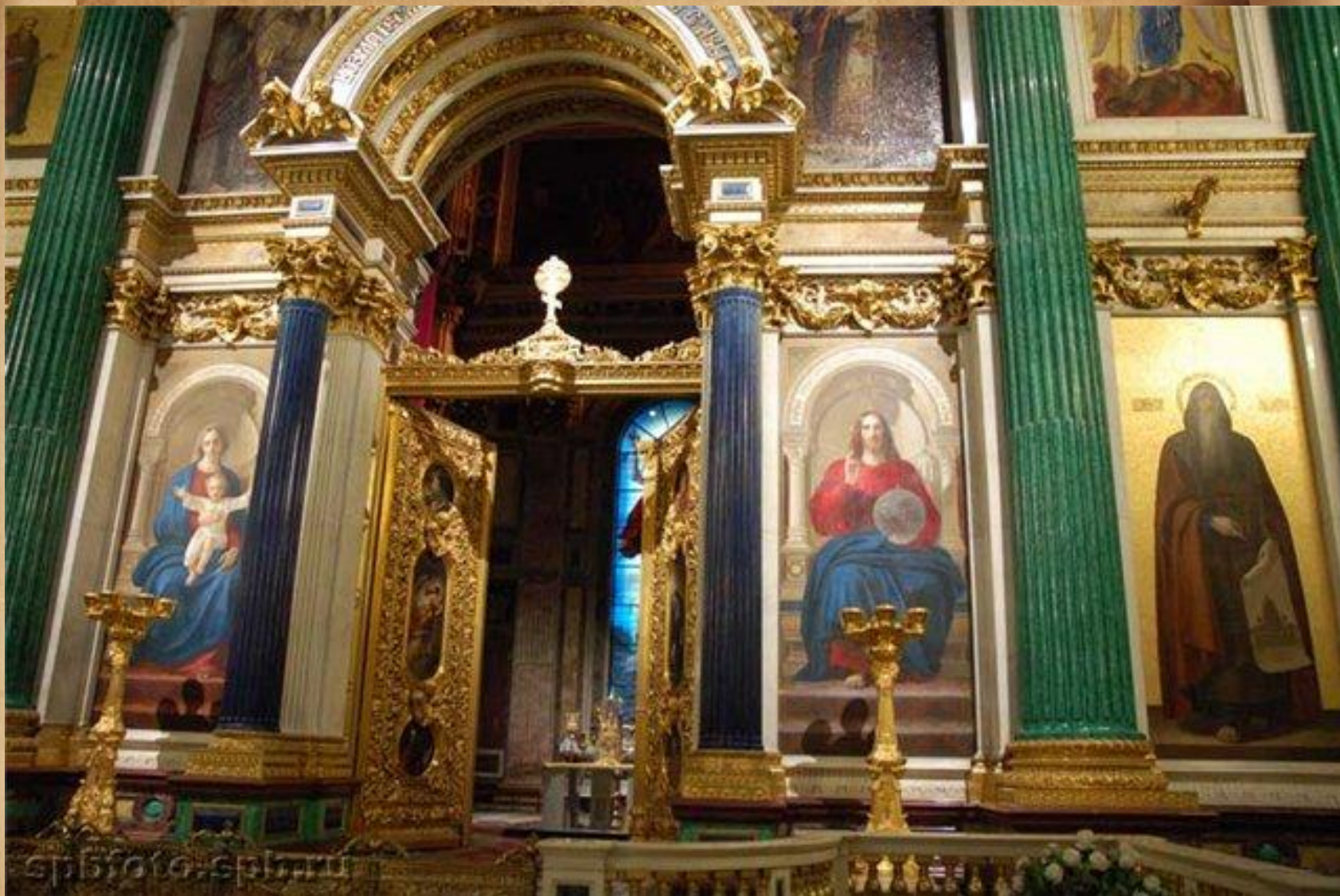
. Иконостас Исаакиевского собора.