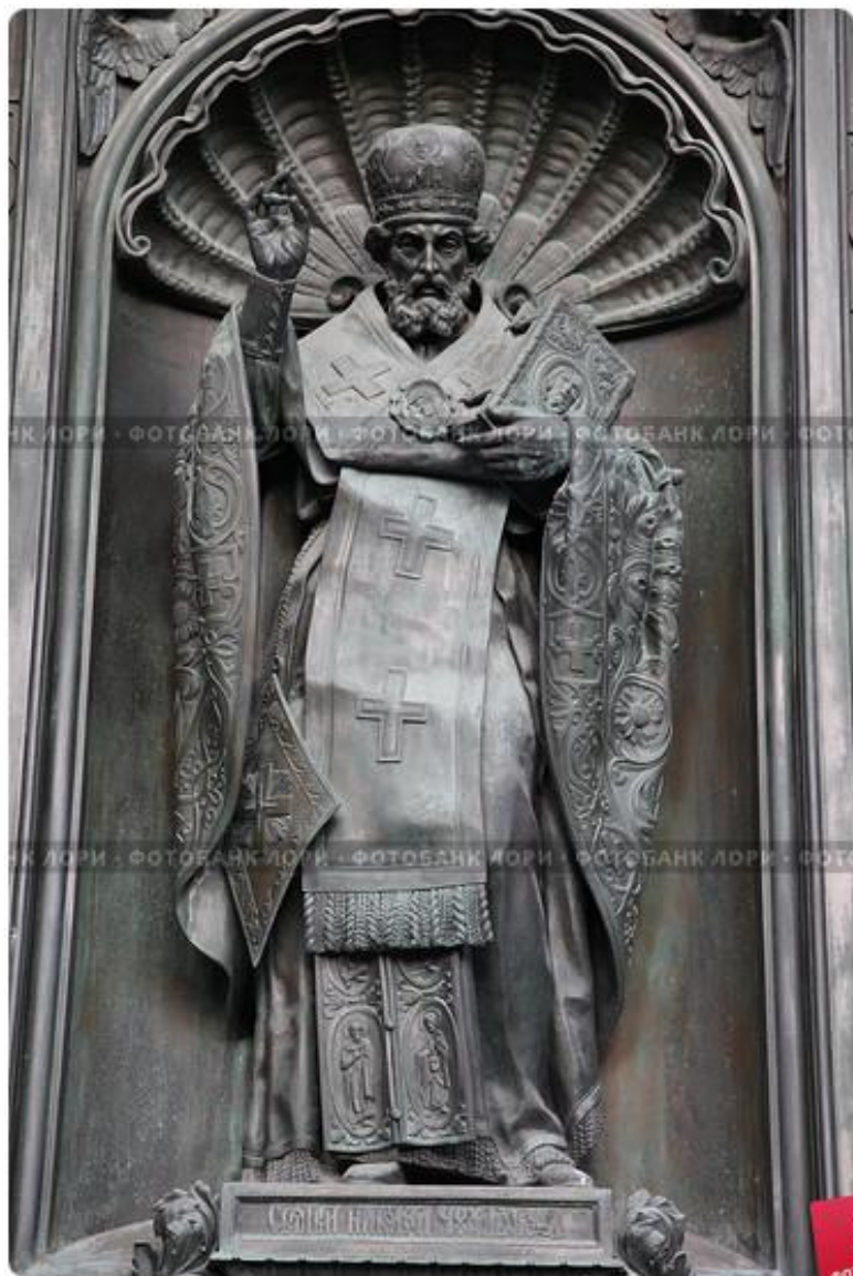
Исаакиевский собор, скульптура "Николай Чудотворец" на северных дверях храма

© С. С. Смирнов, Л. С. Смирнова, Л. С. Смирнов