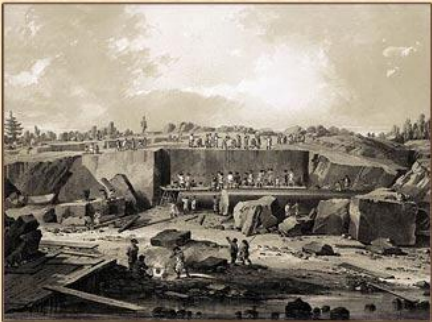
ВЫРУБКА ГРАНИТНЫХ КОЛОНН. ЛИСТ ИЗ АЛЬБОМА О. МОНФЕРРАНА 1845 Г