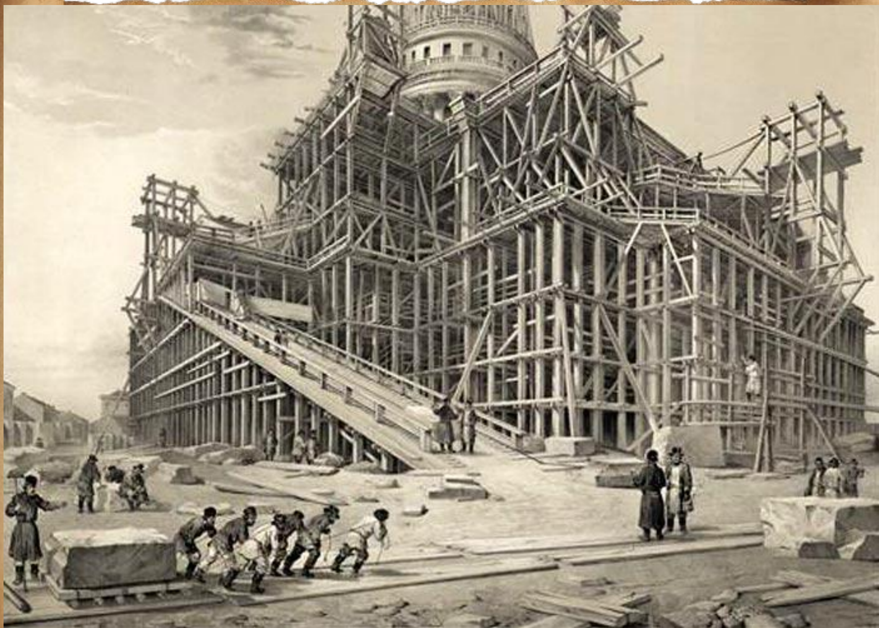
Исаакиевский собор в лесах. Литография с рисунка О.Монферрана.