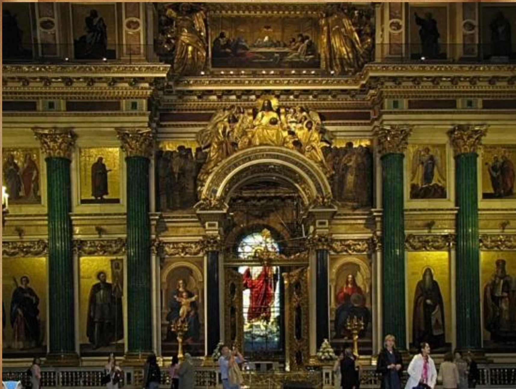
Иконостас Исаакиевского собора.