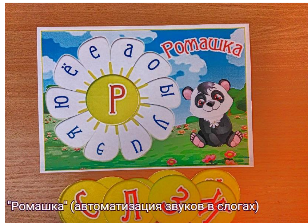
"Ромашка" (автоматизация звуков в слогах)