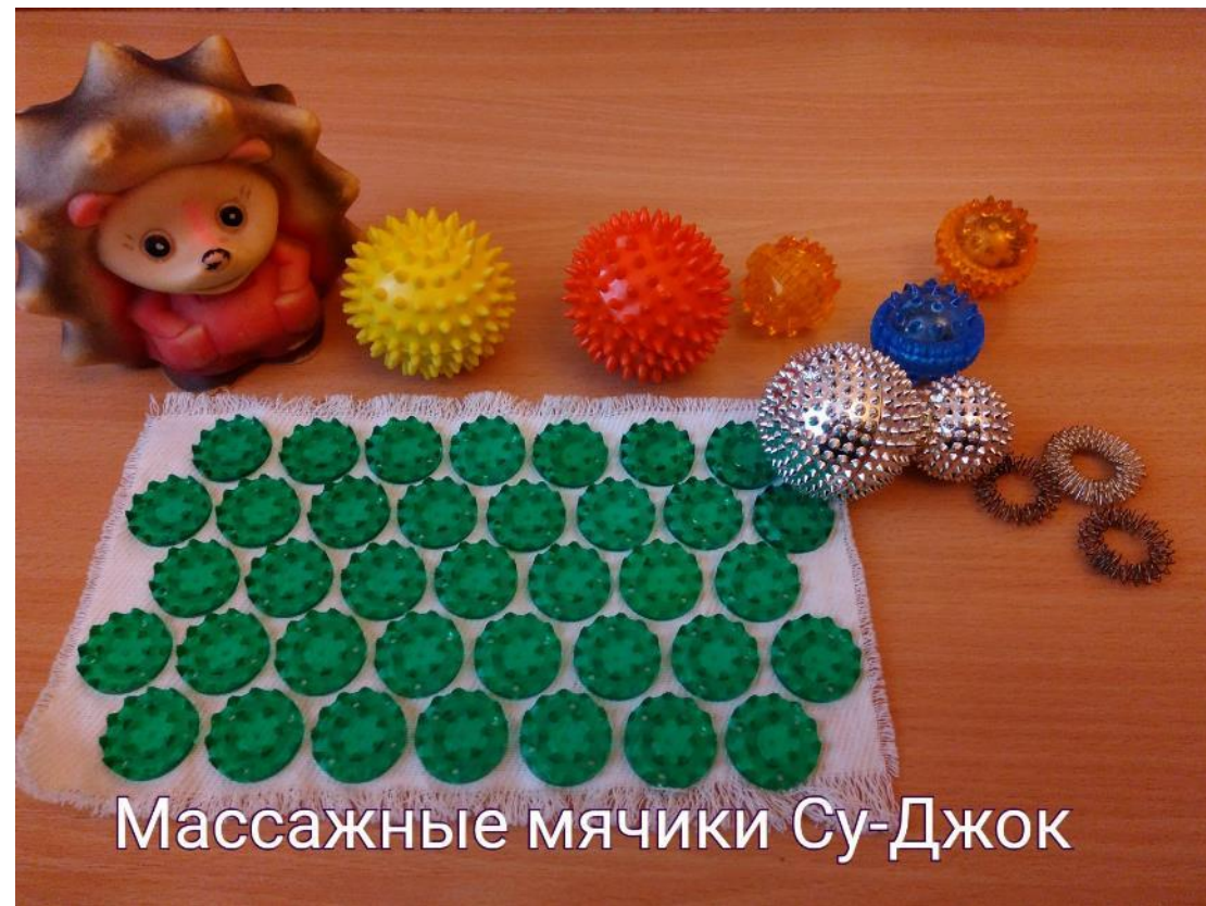
Массажные мячики Су-Джок