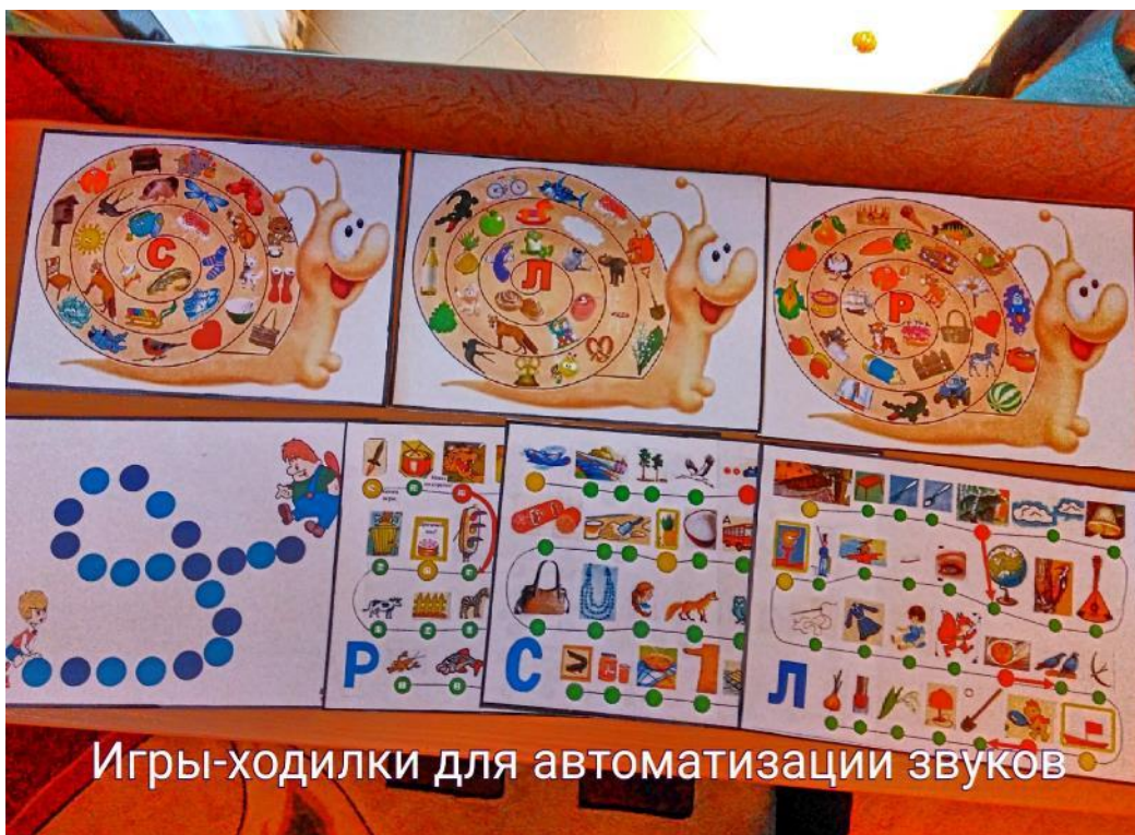
Игры-ходилки для автоматизации звуков

Дидактические игры, используемые в коррекции звукопроизношения, решают такие дидактические задачи, как подготовка артикуляционного аппарата к постановке нарушенного звука и закрепления правильного звукопроизношения.