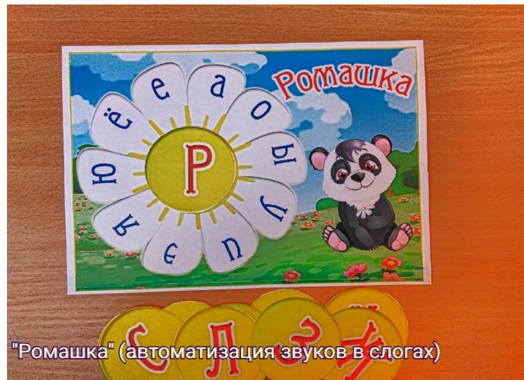
"Ромашка" (автоматизация звуков в слогах)