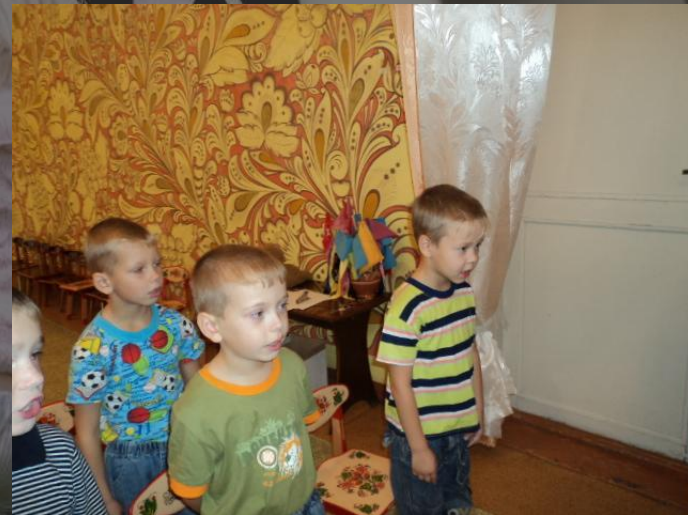
«Слушай и пой»