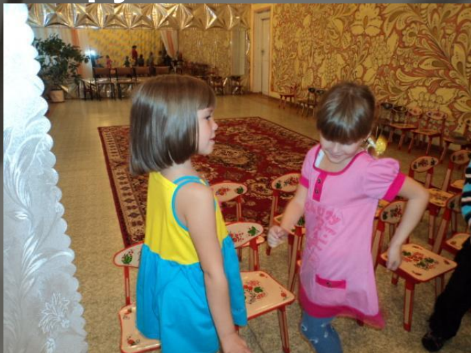
«Послушай и протанцуй»

1. Восприятие музыки – ведущий вид деятельности, потому что с первых минут жизни каждый человек обладает чувствами, эмоциями, восприятием окружающего.