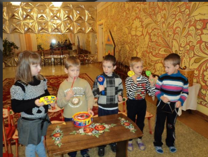
«Послушай и подыграй»