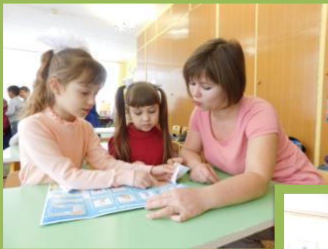
Знакомимся с новым лэпбуком