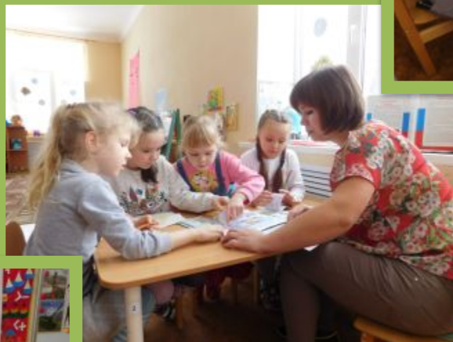
Украшаем лэпбук наклейками