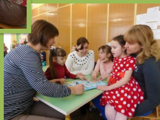
Играем с родителями