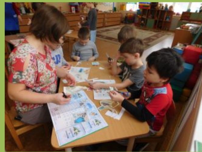
Складываем кармашки - секретики