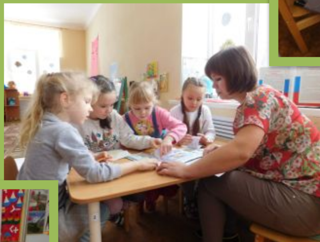
Украшаем лэпбук наклейками