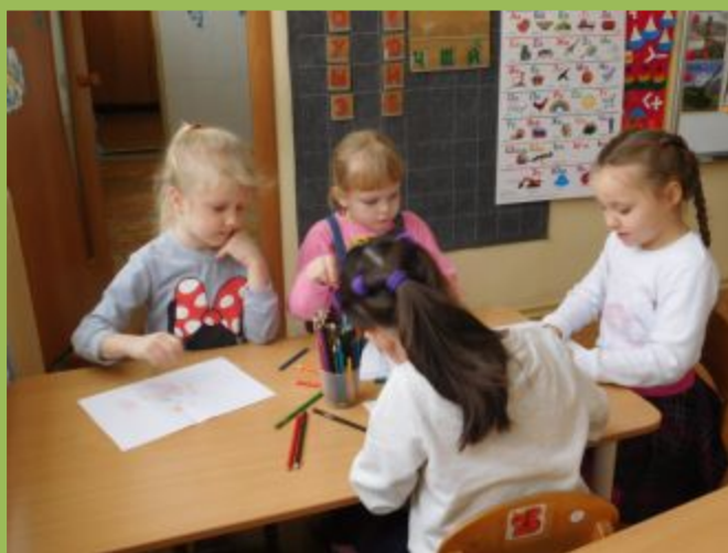
Дети раскрашивают свое творение