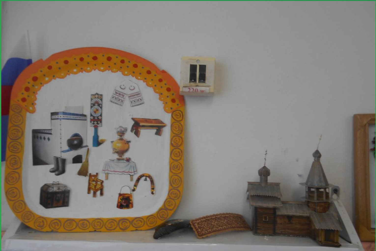
Выставка «Русская изба»