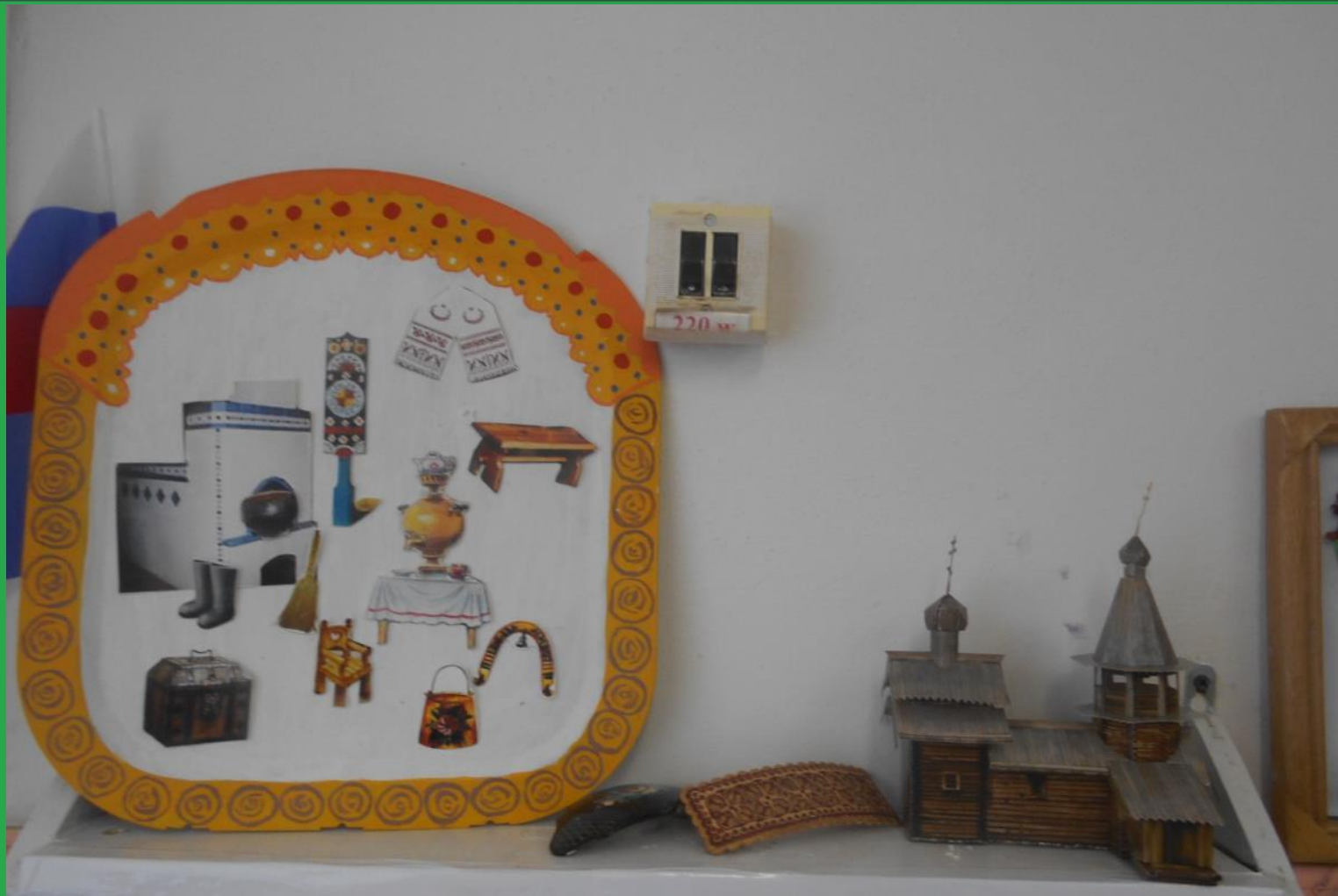
Выставка «Русская изба»