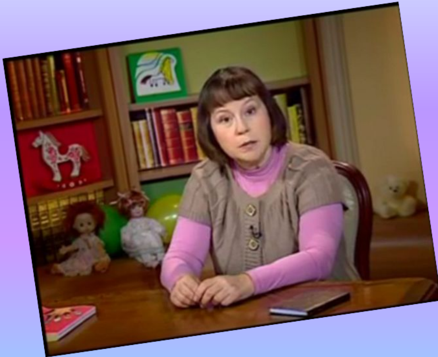
«Взрослым о детях»