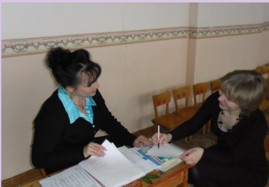
Решение педагогической ситуации