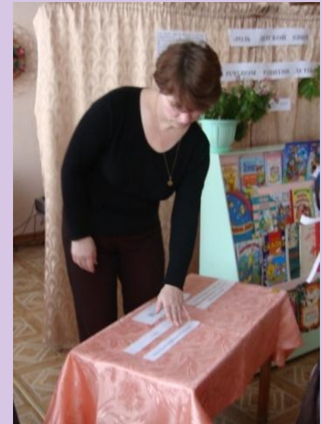
Задание «Определи формы и методы в соответствии с возрастной группой»