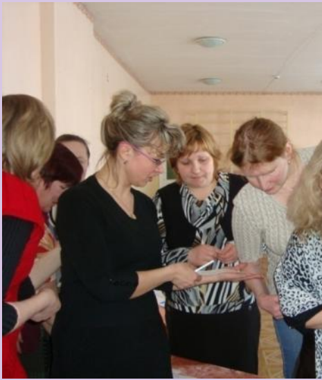
Педагоги в творческом процессе