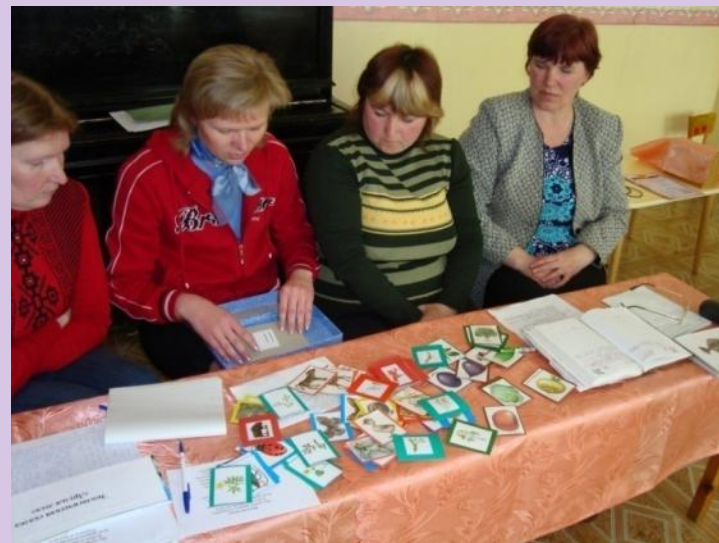
Презентация дидактических игр