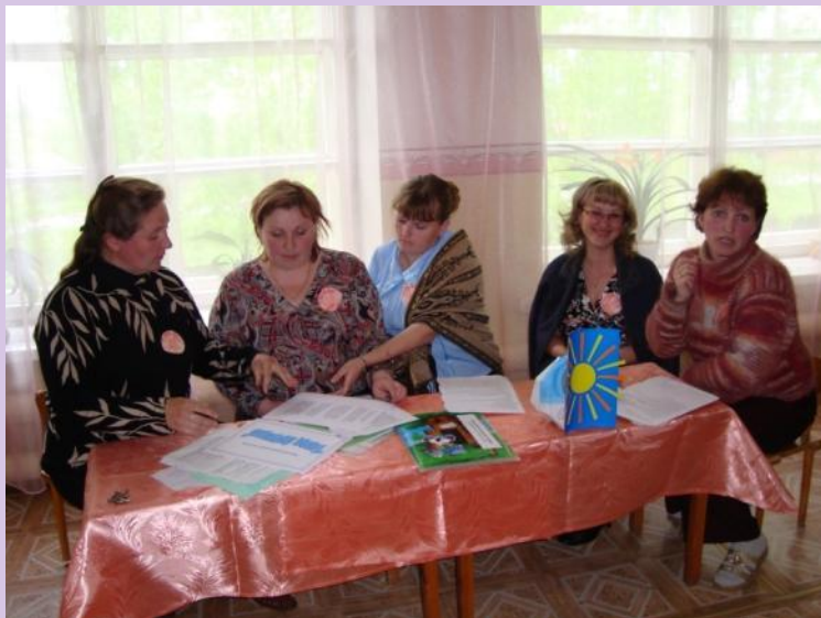
Решение экологических задач