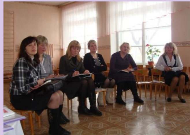
Гости педсовета – старшие воспитатели детских садов города