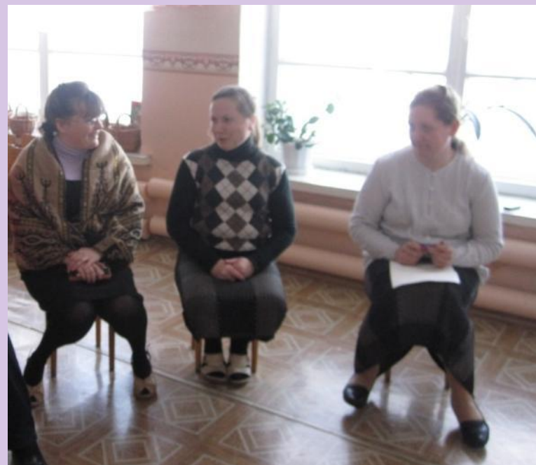
Игра «Поприветствуй друг друга»