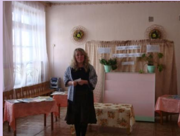
Конкурс на лучшее детское стихотворение