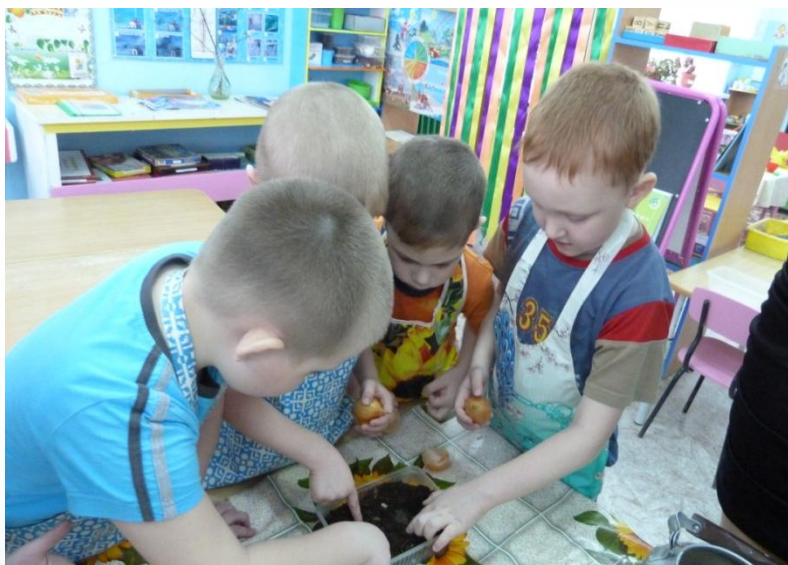
Опыт «Свойства почвы»