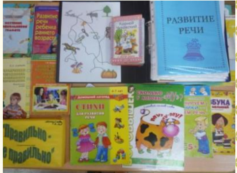
Литература для развития речи