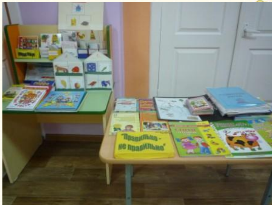
Дидактические игры для развития речи