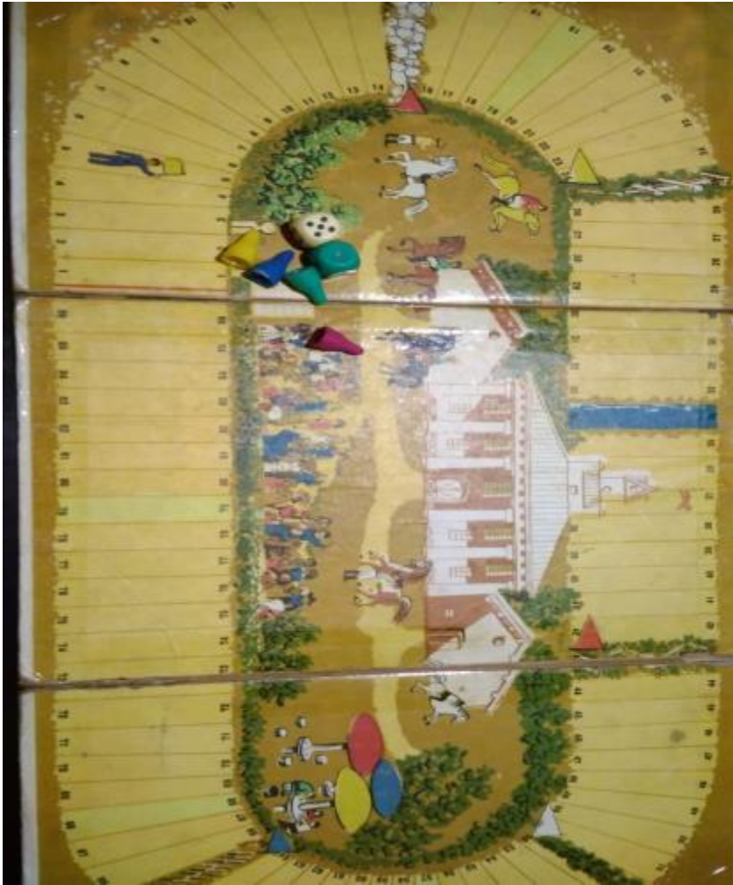
7. СТАРАЯ НАСТОЛЬНАЯ ИГРА