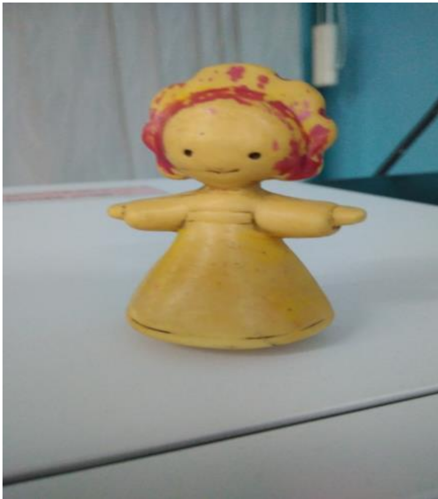
3. РЕЗИНОВАЯ КУКЛА