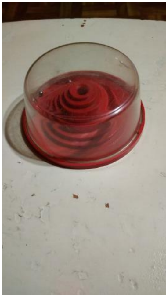
27. ИГРУШКА «ЛАБИРИНТ»