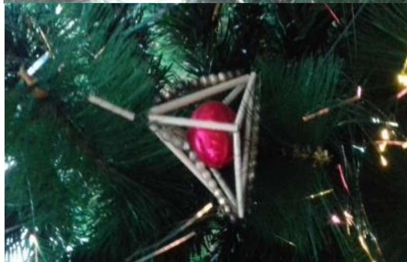
24. МОДНЫЕ ЁЛОЧНЫЕ ШАРЫ