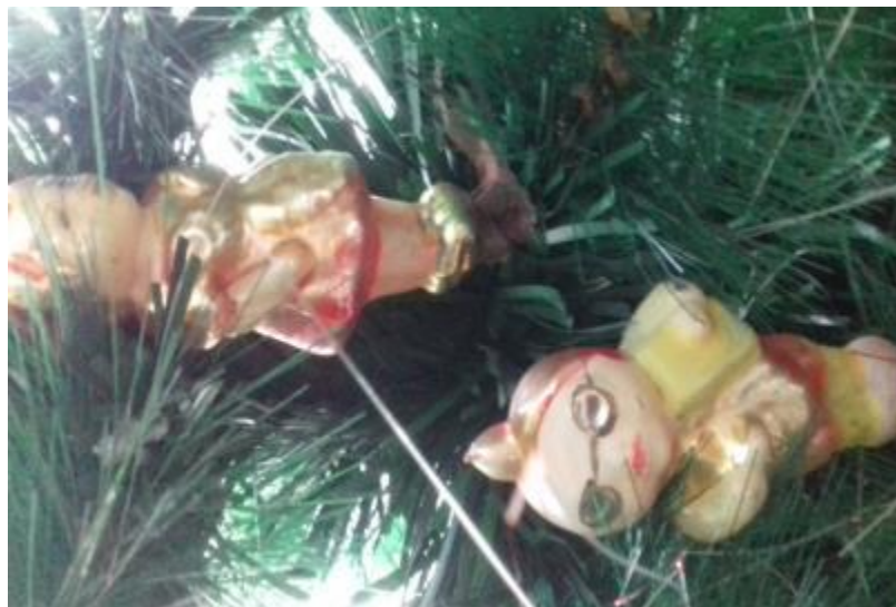
23. СТАРЫЕ ЁЛОЧНЫЕ ИГРУШКИ