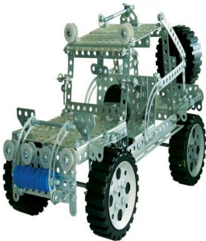
17. КОНСТРУКТОР МОЕГО ПАПЫ