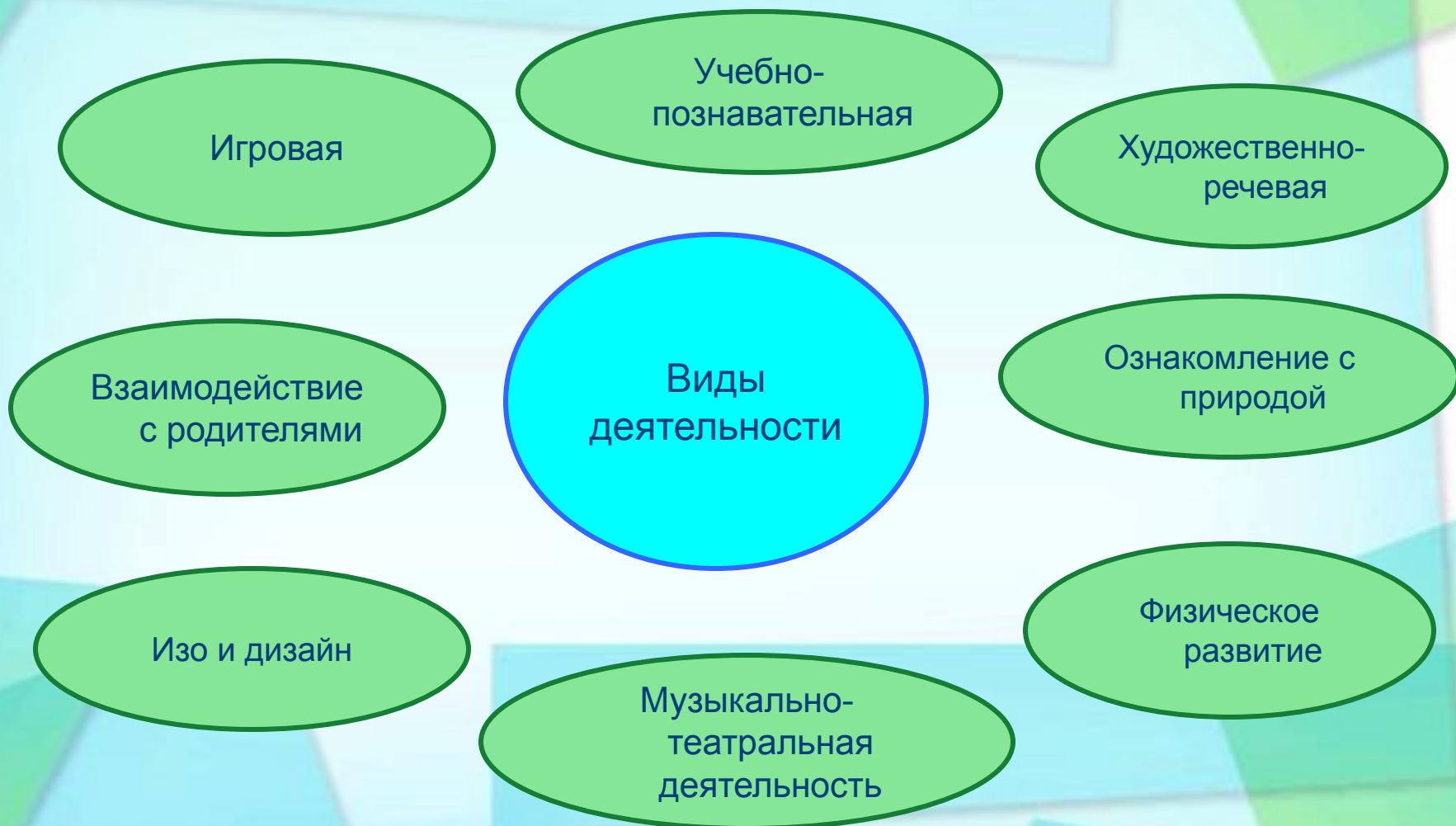
Схема реализации проекта через разные виды деятельности