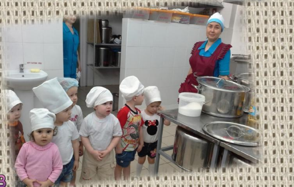
В гостях у поваров